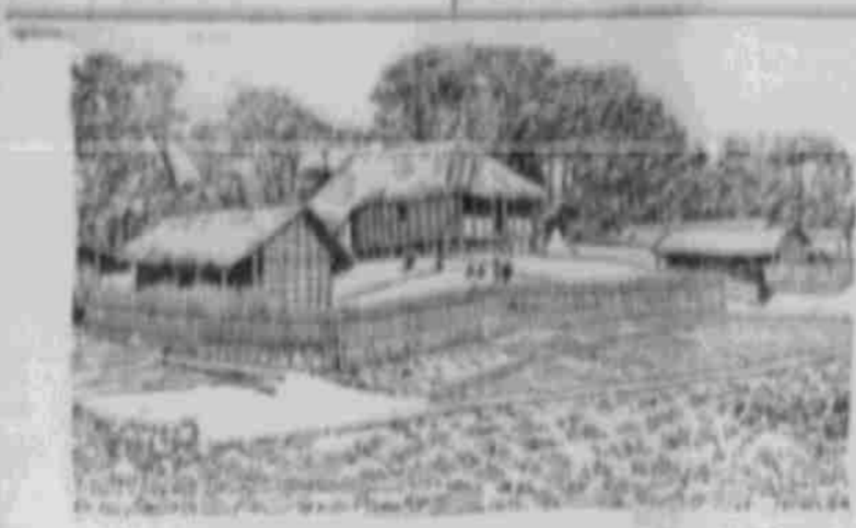
Ein Haus in Kamerun: Fabelhaftes Dschungelhaus.

Während die Eingeborenenweiber, wenn man so sagen kann, Hausstand führen, bringen die Männer ihre Tage, gleich den alten Germanen, mit Jagd und süßem Nichtstun zu.