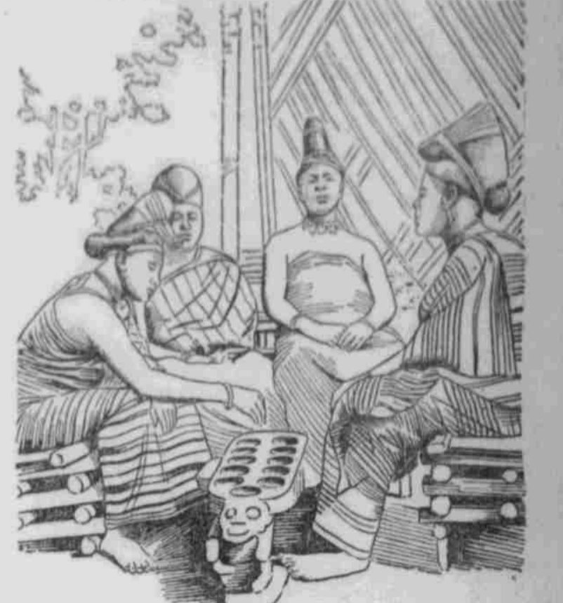
Kamerun: Häuptlingsfrauen von Lamum beim Spiel.