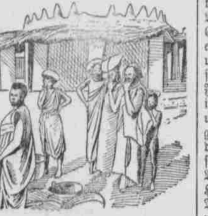
Brauen auf dem französischen Schachfeld - Gebiet.