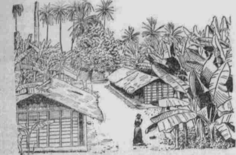
Ein Dorf in Kamerun: Bild in ein Dorf bei Kribi.