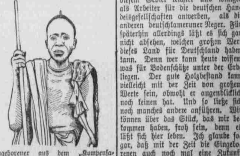
Eingeborener aus dem 'Kompensationengebiet'.