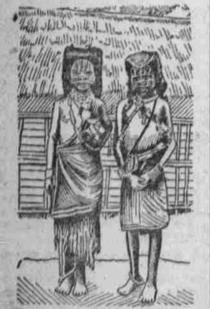
Keule - Leute.