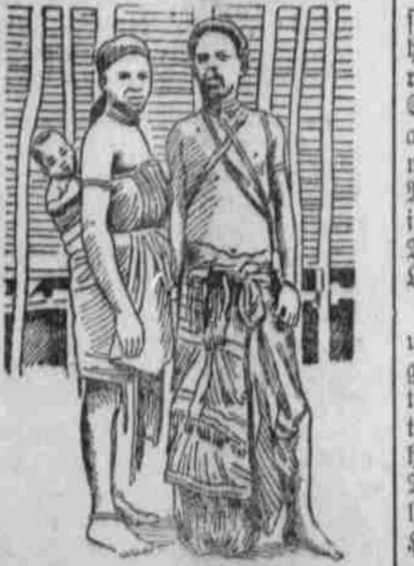
Eingeborene von Mittel-Kongo.