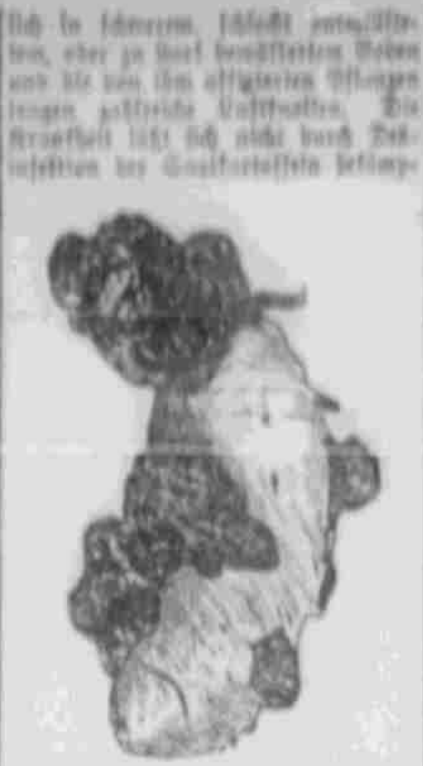
Veranlassung der Kartoffelkrankheiten.