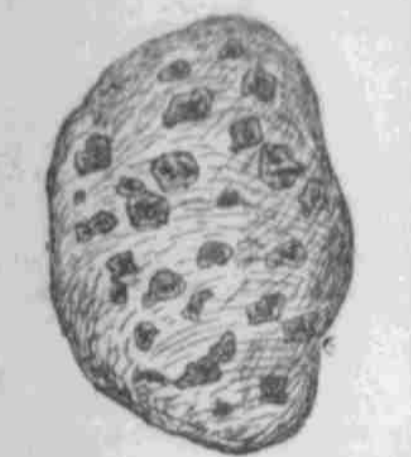
Vom gewöhnlichen „Scab“ angegriffene Kartoffelknolle.