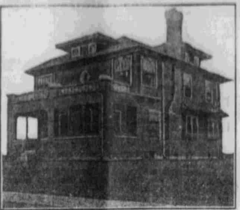
Perspektive von einer Photographie.