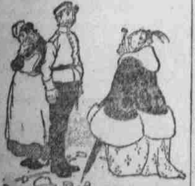
„Schlagfertig. Herr: „Was, Sie hören an der Litz, wenn ich mit meiner Frau gante?“