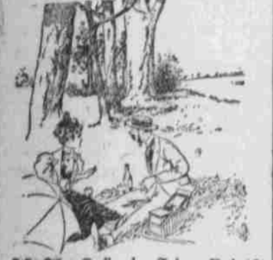
Auch eine schöne Gegend.