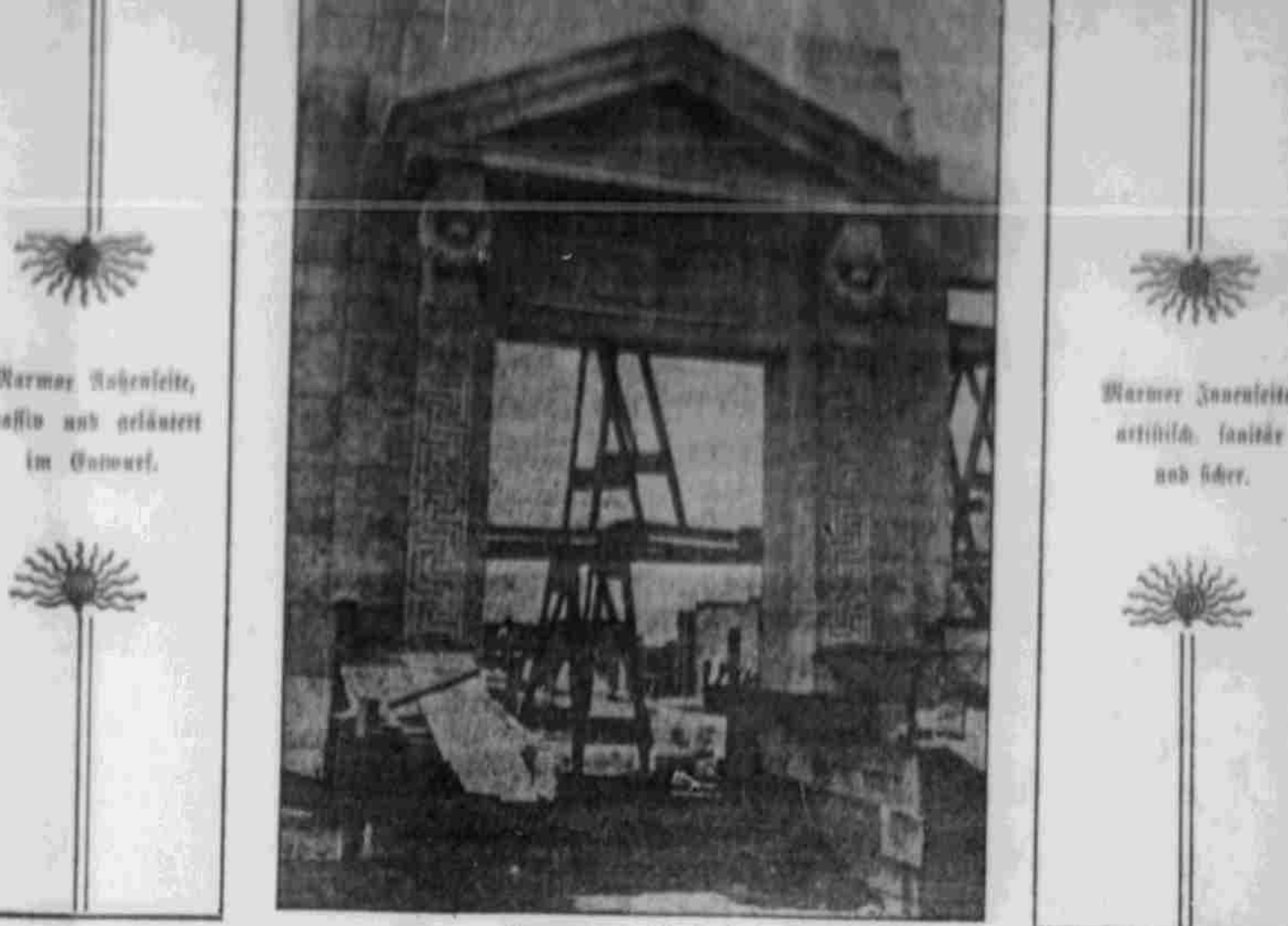
Gingang am Nordende.