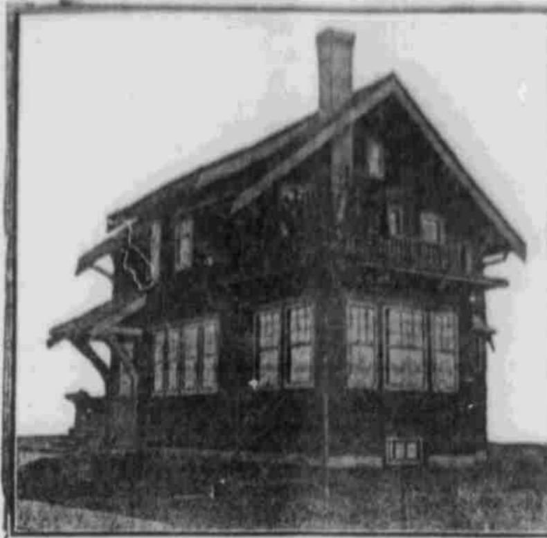
Perspektivansicht—nach einer Photographie.