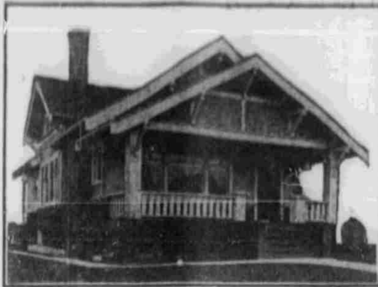
Perspektivansicht—nach einer Photographie.