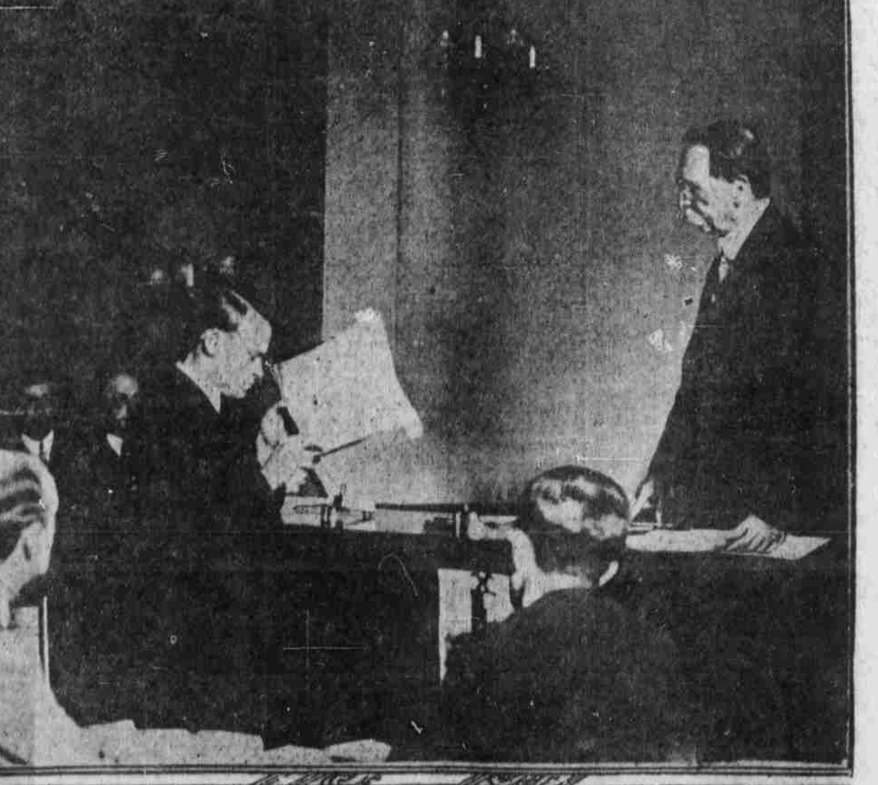
Die Coroners Inquest über jenes sechs Personen, die bei dem Eisenbahnunglück bei Stamford, Connecticut, ums Leben kamen, hat erwiesen, daß die Bremsen der Lokomotive, welche in den Zug der New York-Houston Express hineinfuhr, „untauglich“ waren.