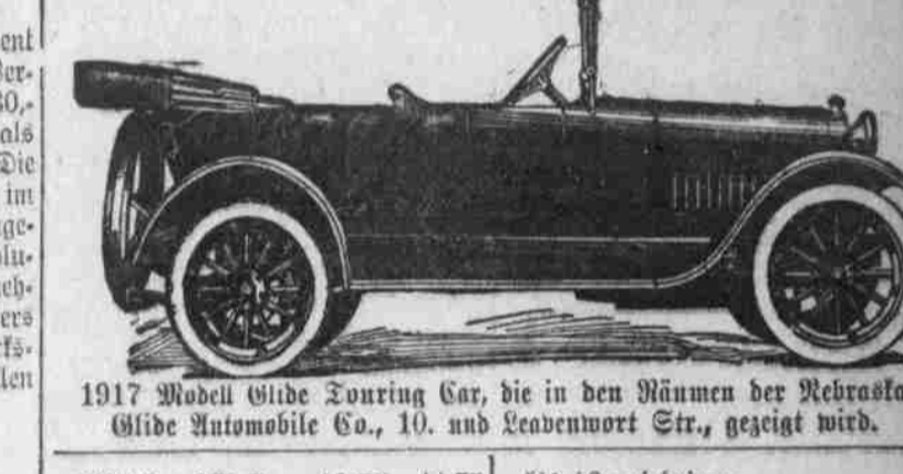
1917 Modell Glide Touring Car, die in den Räumern der Nebraska Glide Automobile Co., 10. und Leavenworth Str., gezeigt wird.

(Werkstoff von Gullish & Co.) Orangen - 25, 27, 28, 29, 30, 31, 32, 33, 34, 35, 36, 37, 38, 39, 40, 41, 42, 43, 44, 45, 46, 47, 48, 49, 50, 51, 52, 53, 54, 55, 56, 57, 58, 59, 60, 61, 62, 63, 64, 65, 66, 67, 68, 69, 70, 71, 72, 73, 74, 75, 76, 77, 78, 79, 80, 81, 82, 83, 84, 85, 86, 87, 88, 89, 90, 91, 92, 93, 94, 95, 96, 97, 98, 99, 100.