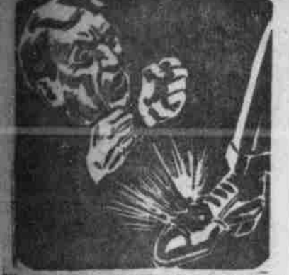
Wunder Hühneraugen löst sich ab mit zauberhaftem „Gels-Jr“!

Die Hühneraugen lösen sich ab mit zauberhaftem „Gels-Jr“!