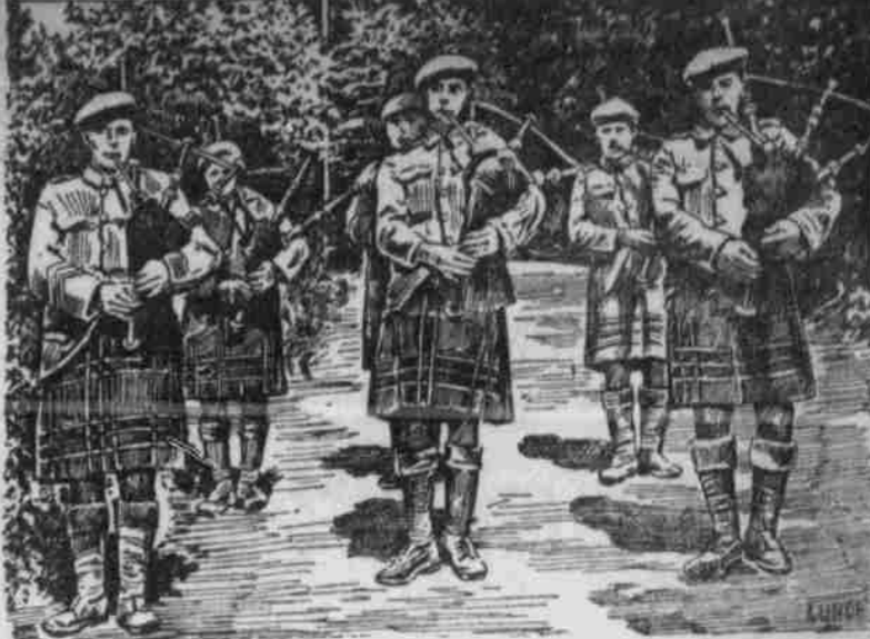
Schottische Dudelsackspieler entlocken ihren merkwürdigen Instrumenten durchdringende Töne.