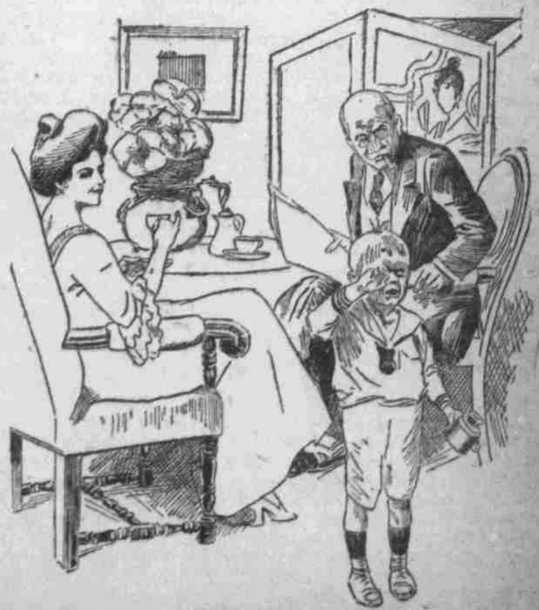
Was brüht denn der Junge den ganzen Tag? Weißt du, es mödie auch so gern Aircasanteile zeichnen!

zeit, die in körperlicher Entwicklung nicht viel unter dem heutigen Nordeuropäer standen.