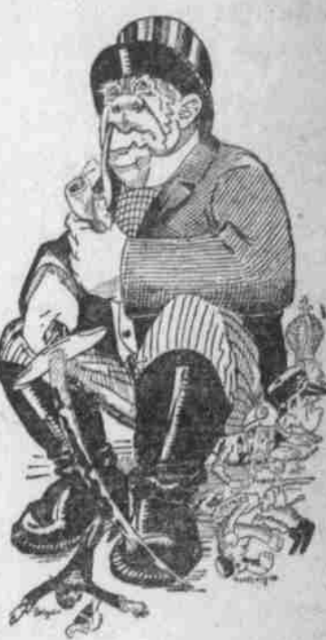
Die Einmütigkeit der Entente ist größer als je.