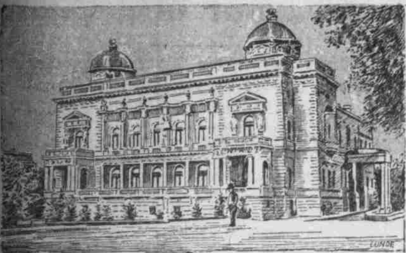
Der Kanal, der Königsplatz in St. Petersburg.