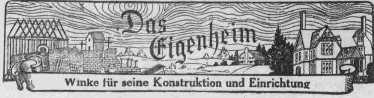
Winke für seine Konstruktion und Einrichtung