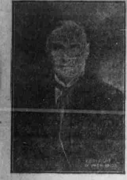
Walter Damrosch, Dirigent des New York Symphonie Orchester, welches am Freitag, den 30. März, im städtischen Auditorium ein Konzert abhalten wird.