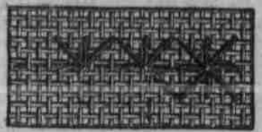
Ausführung des gleichseitigen Kretzenstiches, in 2 Arbeitsgängen hergestellt.