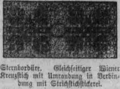
Sternenbordüre. Gleichseitiger Wiener Kreuzstich mit Umrandung in Verbindung mit Strichstichstickerei.