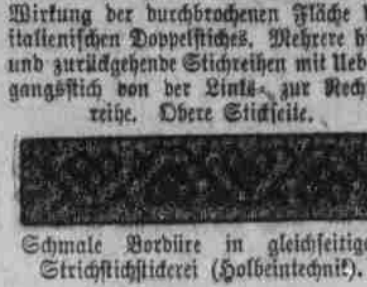
Schmale Bordüre in gleichseitiger Strichstichstickerei (Solbentechnik).