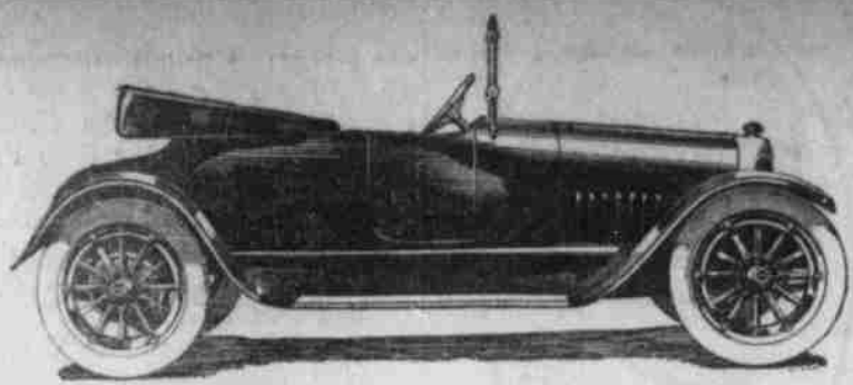
Apperson 8-Zylinder Roadster.

Bei der Herstellung dieser Car kamen nur die neuesten Erfindungen der Motorindustrie zur Verwendung, so der weltberühmte Continental Motor, Borg und Best Clutch, Hess-Bright volllaufende Hinterachsen und vieles andere. Die Car hat die härtesten Proben erfolgreich bestanden und ist zweifellos eine der besten, wenn nicht die beste Sechser in der $1150 Preisklasse, die in der Omaha Automobil-Ausstellung zur Ausstellung gelangten.