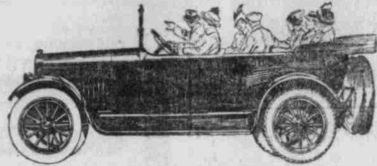
Allen Car, eine der beliebtesten leichten Automobile; wird von der Standard Motor Car Co. verkauft.