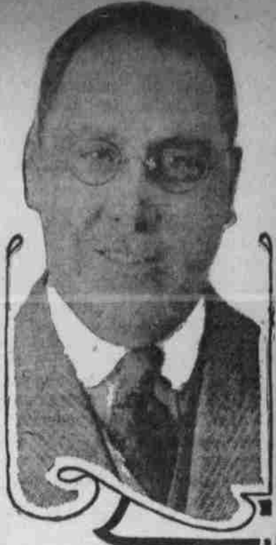
E. V. ABBOTT

Die „Grant Sig“ wird hier in Omaha von der Apperjon Motor Car Co. verkauft, deren Geschäfts-