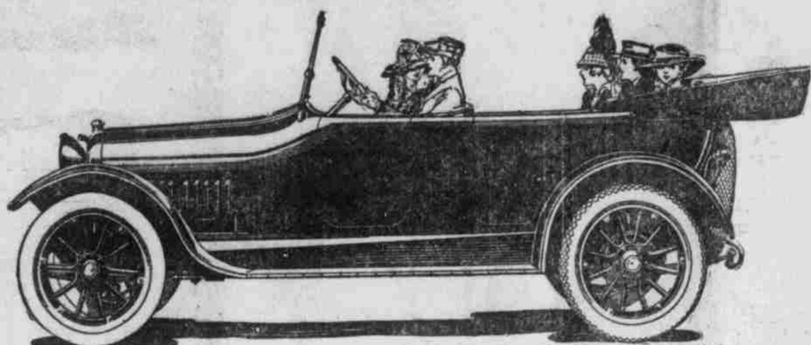
1917 Modell Velie Light Six. — L. E. Doty, Inc., Verkäufer, Omaha, Neb.