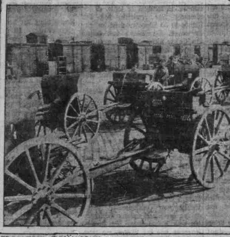
ERBEUTETE RUMÄNISCHE GESCHÜTZE

Die Orlova-Gruppe des Gegners löste sich nach unserem weiteren Vordringen über die Stellung. Auf Bozovici, die unternahm, auf dem rechten Ufer der Donau einzeln einzelne Bataillone dieser Gruppe auf, sie gehörten verschiedenen Regimenten an und waren anscheinend eilig mit der Bahn von Turnu-Severin bis Moresti gerufen worden, offenbar hatte die kleine Schwadron den merkwürdigen Auftrag, unsere Einfallstruppe im Rücken anzugreifen. Da, wo der geschlagene rechte Flügel des Feindes sich mit noch immer starken Kräften in den Bergen hielt, sind die Operationen in glücklicher Ermüdung begriffen. Nach wie vor bleiben die Fortschritte unserer Roten-Turm-Gruppe von großer Bedeutung. Die von ihr heute und gestern erlangten Erfolge sind die wertvollsten Erfolge der Operationen in dieser Richtung, wobei besonders wichtig ist, daß diese Fortschritte zu beiden Seiten des Dni gemacht werden. Gefangenenangaben von gestern belegen, daß der Gegner hier eine verstärkte Front zu entwickeln beabsichtigt. Der rumänische Widerstand in der nördlichen Walachei ist nahezu gebrochen, Führung und Truppe haben ihr Alles gegeben, das Unheil abzumenden, das über das Land jetzt hereinbricht.