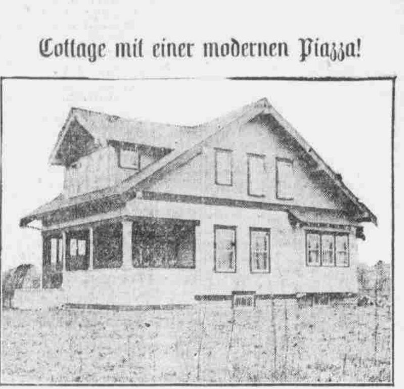
Perspektivansicht nach einer Photographie.