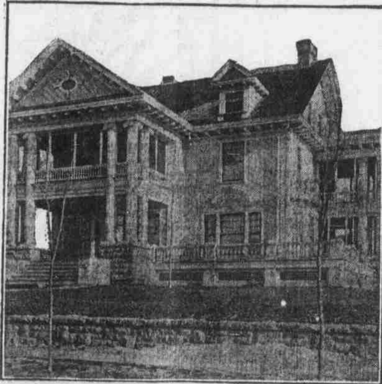
Perspektivanicht nach einer Photographie.