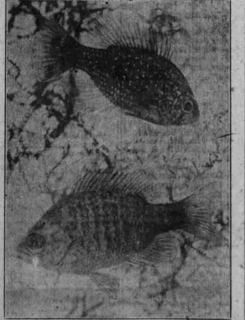
Spotted Fin Sunfish. (Enneacanthus gloriosus.) Lepomis miniatus.

Unsere heimischen Sonnenfische werden als Aquarienfische lange nicht so geschätzt, als es eigentlich der Fall sein sollte. In der Farbenpracht ihres Schuppenkleides, in der lebhaften Färbung vieler Arten und in der Widerstandsfähigkeit gegen Witterungsverhältnisse nehmen sie es gerotzt mit allen anderen Fischen auf.