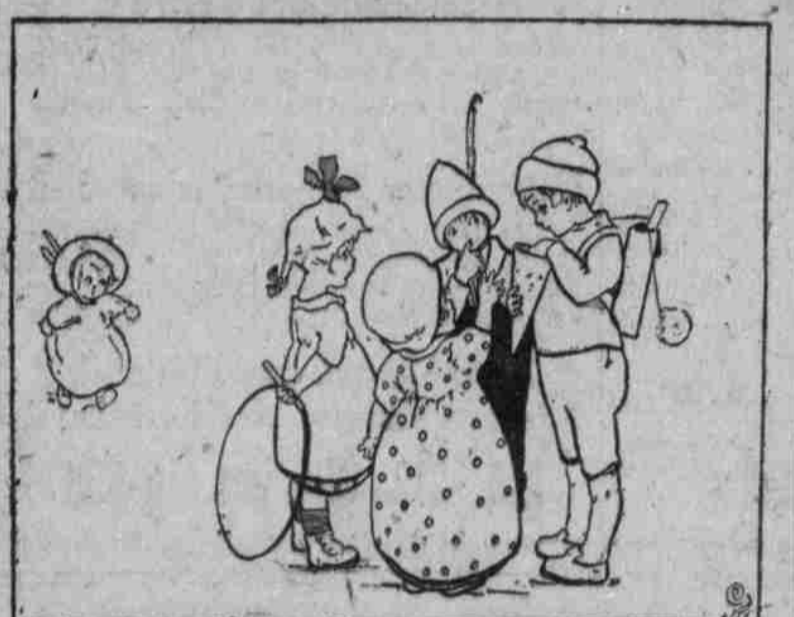
Ein aufregender Augenblick: Wird Peter uns etwas geben?

Selbsthergestelltes Spielzeug macht Euch sicher immer die milde Freude, noch dazu, wenn es 'beweglich' ist. Unsere Abbildung zeigt, wie sich aus den einfachsten Mitteln ein wenig Geschicklichkeit ein nettes Spielzeug herstellen läßt, das selbst einen größeren Kinderkreis lange zu unterhalten vermag.