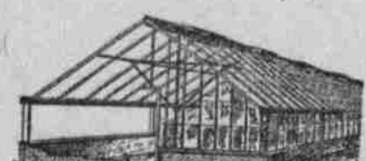
Treibhaus mit gleichmäßiger Spannung.

Die Gurke ist eine der wenigen Gartenpflanzen, die sich außer im freien Felde auch mit gutem Erfolge im Treibhaus ziehen und dadurch zu bedeutend reichlicher Reife bringen lassen.