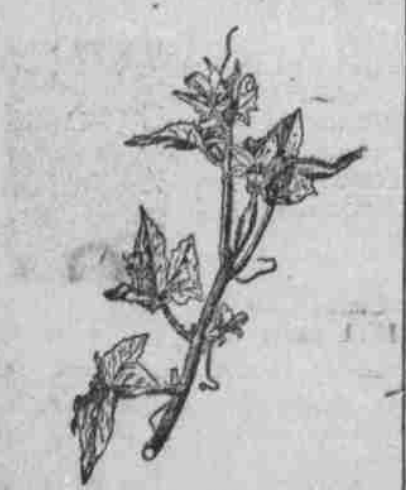
Unfruchtbare Blüte der Gurke.

Für die Treibhauskultur ist natürlich in erster Linie ein passender Bau erforderlich, der reichlich Licht, genügender Raum und hinreichende Strahlung bietet, um eine befriedigende Temperatur von 65 bis 85 Grad F. aufrecht zu erhalten.