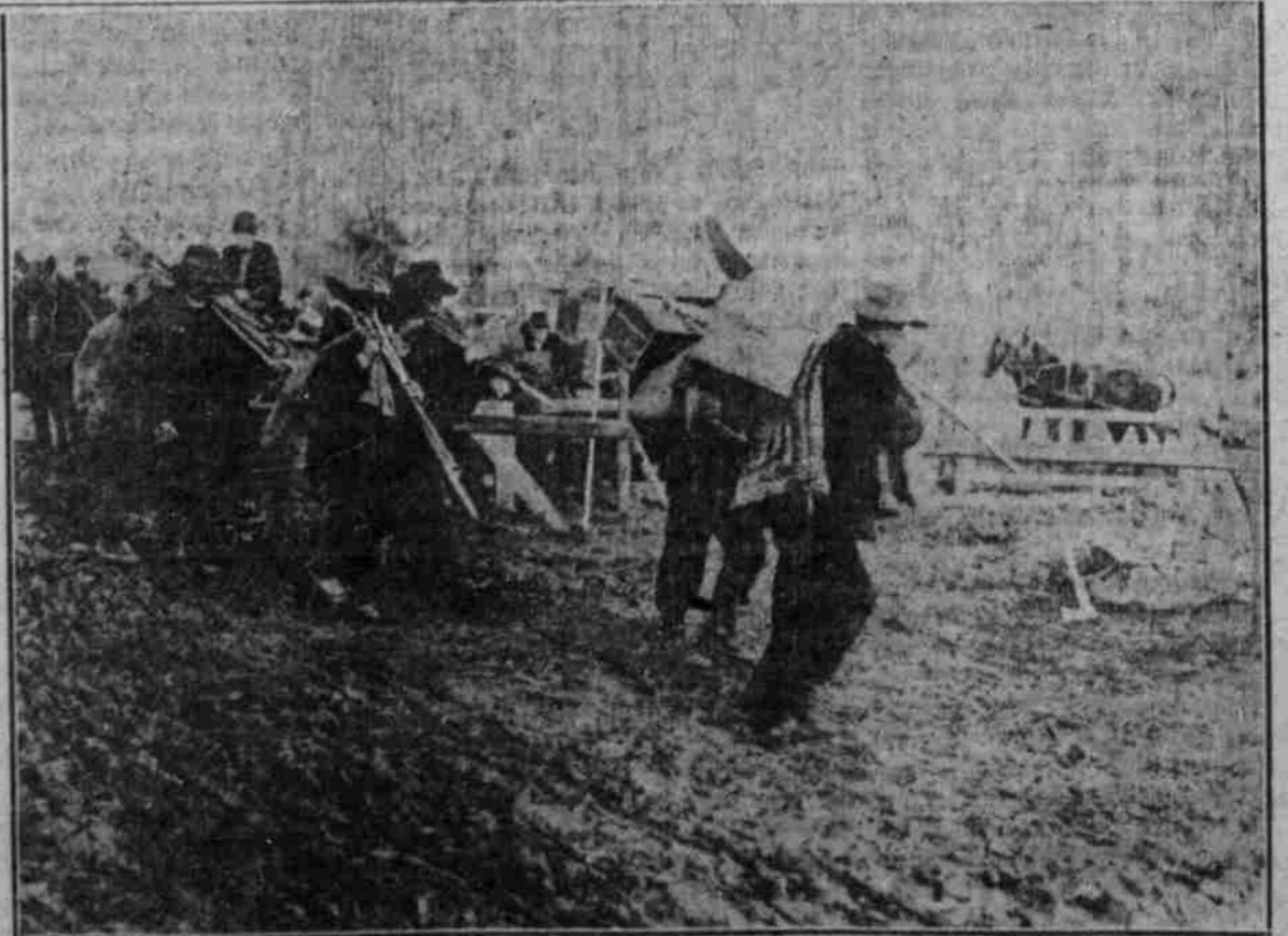
Serbische Arbeiter bei der Straßenverbesserung.