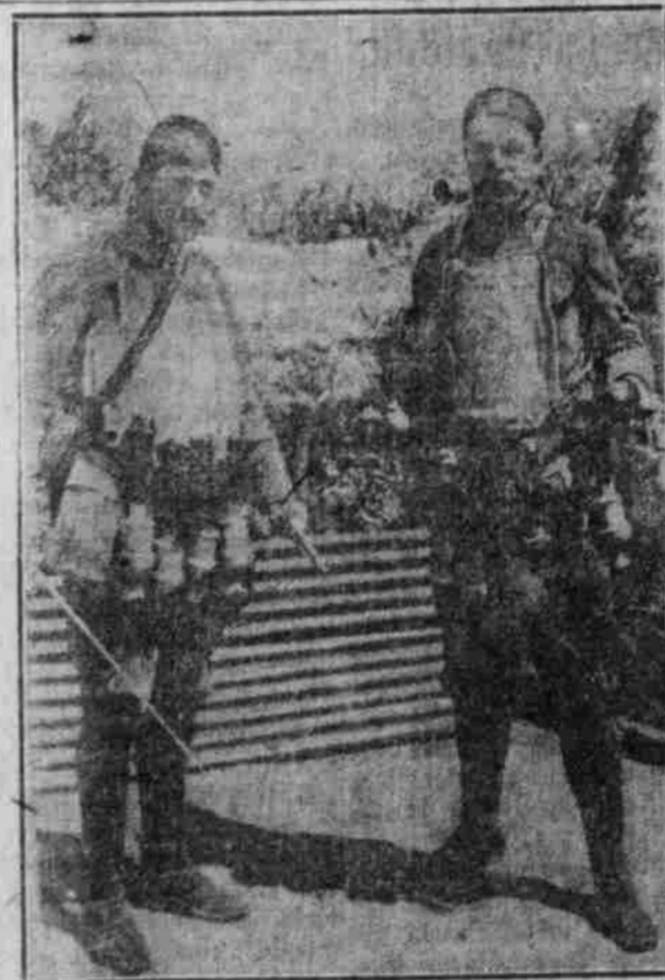
Französische Grenadiere, die sich zu einem Angriff auf deutsche Schützengräben vorbereiten. Sie tragen einen Stahlhelm und Stahlpanzer und sind mit Handgranaten und Bomben bewaffnet. Der eine trägt eine Sense zum Durchschneiden von Hindernissen.