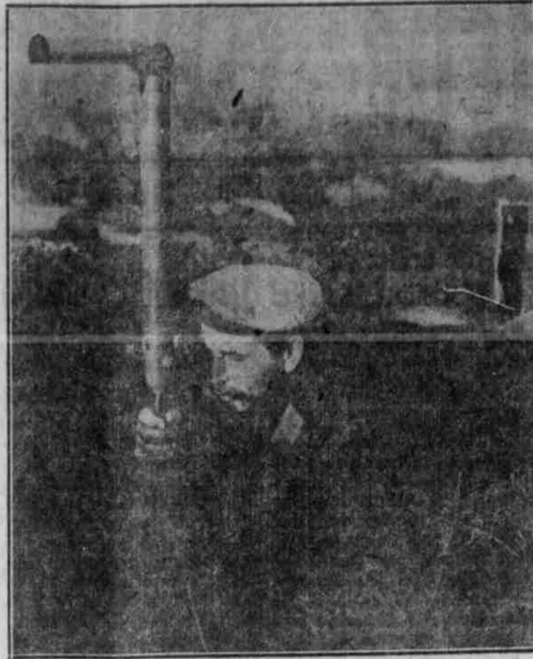
An der flandrischen Küste: Matrose am Fernrohr.