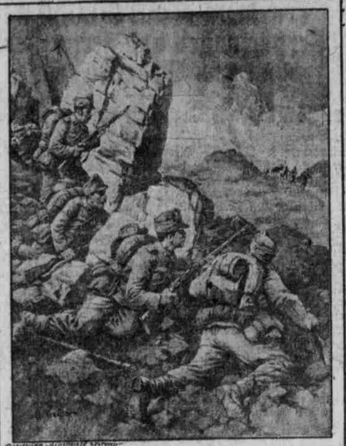
ÖSTERREICHISCHE PATROUILLE IN SÜDTIROL. ITALIENISCHEN ALPEN AUFLAUERND.

Tabakausfuhrverbot in der Türkei. Wie die „Bereinigten Tabakgesellschaften“ von unterrichteter Seite erfahren, beabsichtigt die türkische Regierung, ein Verbot der Ausfuhr einheimischen Tabaks zu erlassen. Auch der bulgarische Staat will sich einem solchen Vorgehen anschließen, was in erster Linie dem eigenen Bedarf und den der Verbündeten sicherzustellen.