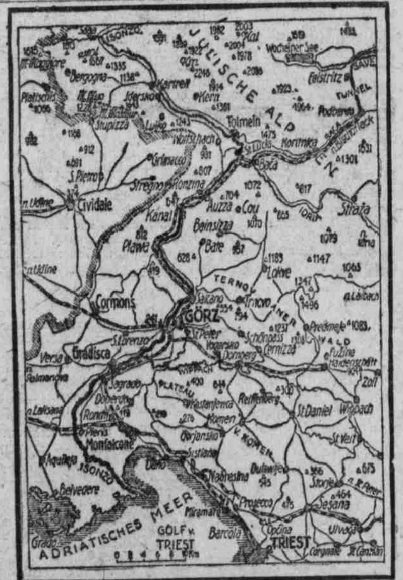
DER LAUF DES ISONZO

Tabakausfuhrverbot in der Türkei. Wie die „Bereinigten Tabakgesellschaften“ von unterrichteter Seite erfahren, beabsichtigt die türkische Regierung, ein Verbot der Ausfuhr einheimischen Tabaks zu erlassen. Auch der bulgarische Staat will sich einem solchen Vorgehen anschließen, was in erster Linie dem eigenen Bedarf und den der Verbündeten sicherzustellen.