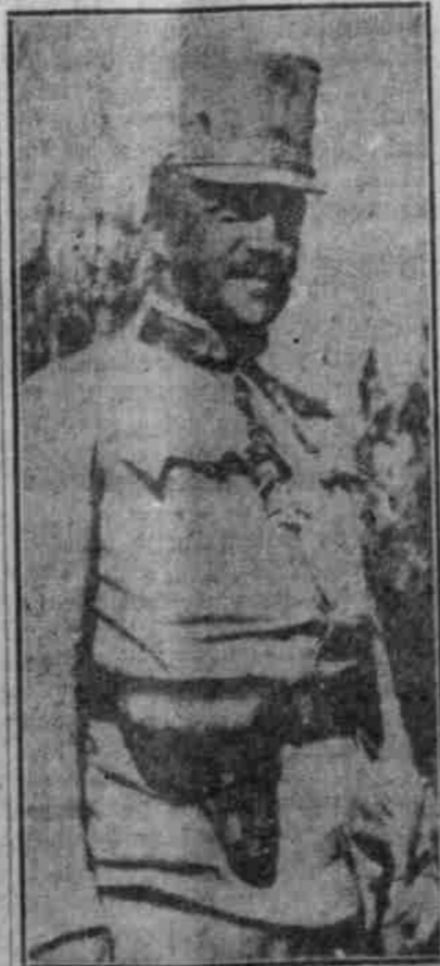
Erzherzog Josef von Österreich.