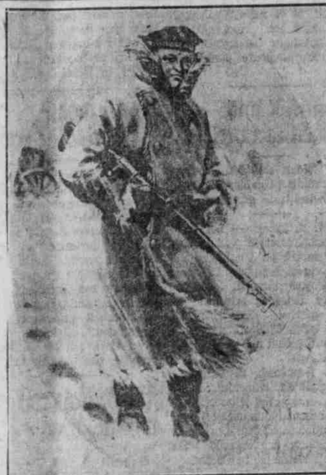
Deutsche Maxime-Infanterie auf Vorposten an der flandrischen Küste.