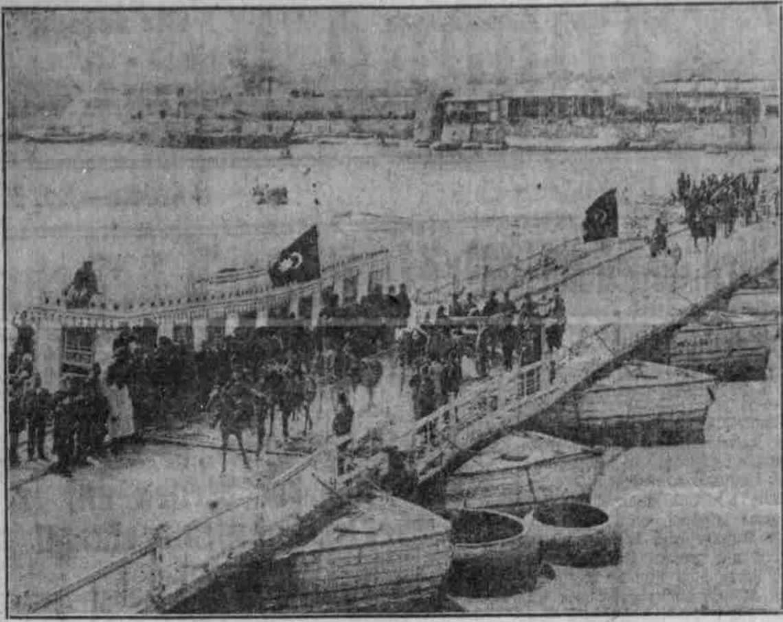
Türkische Truppen rüden von Bagdad zum Kriegsschauplatz aus.