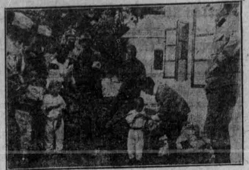
Militärärzte impfen Kinder in Ostgalizien gegen Cholera.