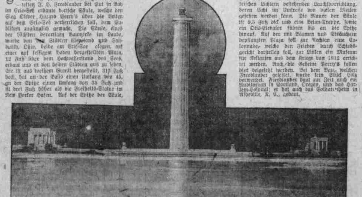
Die von der Perry's Victory Centennial Commission errichtete Gedächtnis-Säule fertiggestellt.

Das Stickmuster kann direkt von der Zeichnung abgegriffen werden. Wer sich die große Arbeit nicht machen will, beschränkt sich auf die Ausführung des Schriftzuges oder des Blumenornaments, das nach Belieben in rot, blau oder mehrfarbig gefärbt wird.