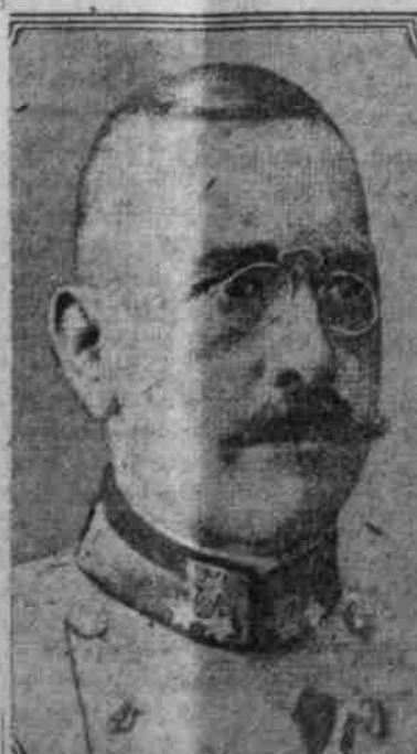
General von DANKL