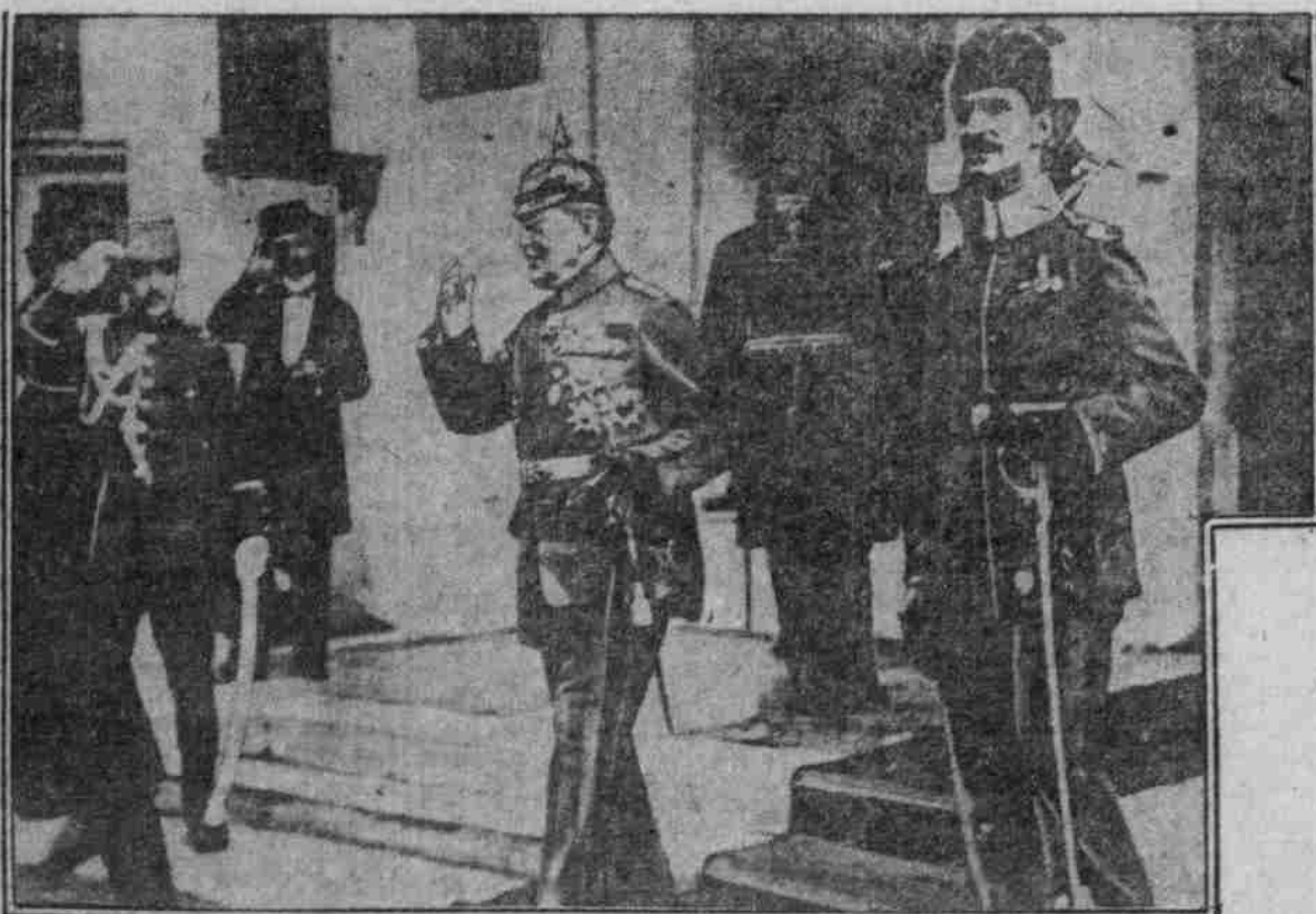
FELDMARSCHALL von der GOLTZ in KONSTANTINOPEL