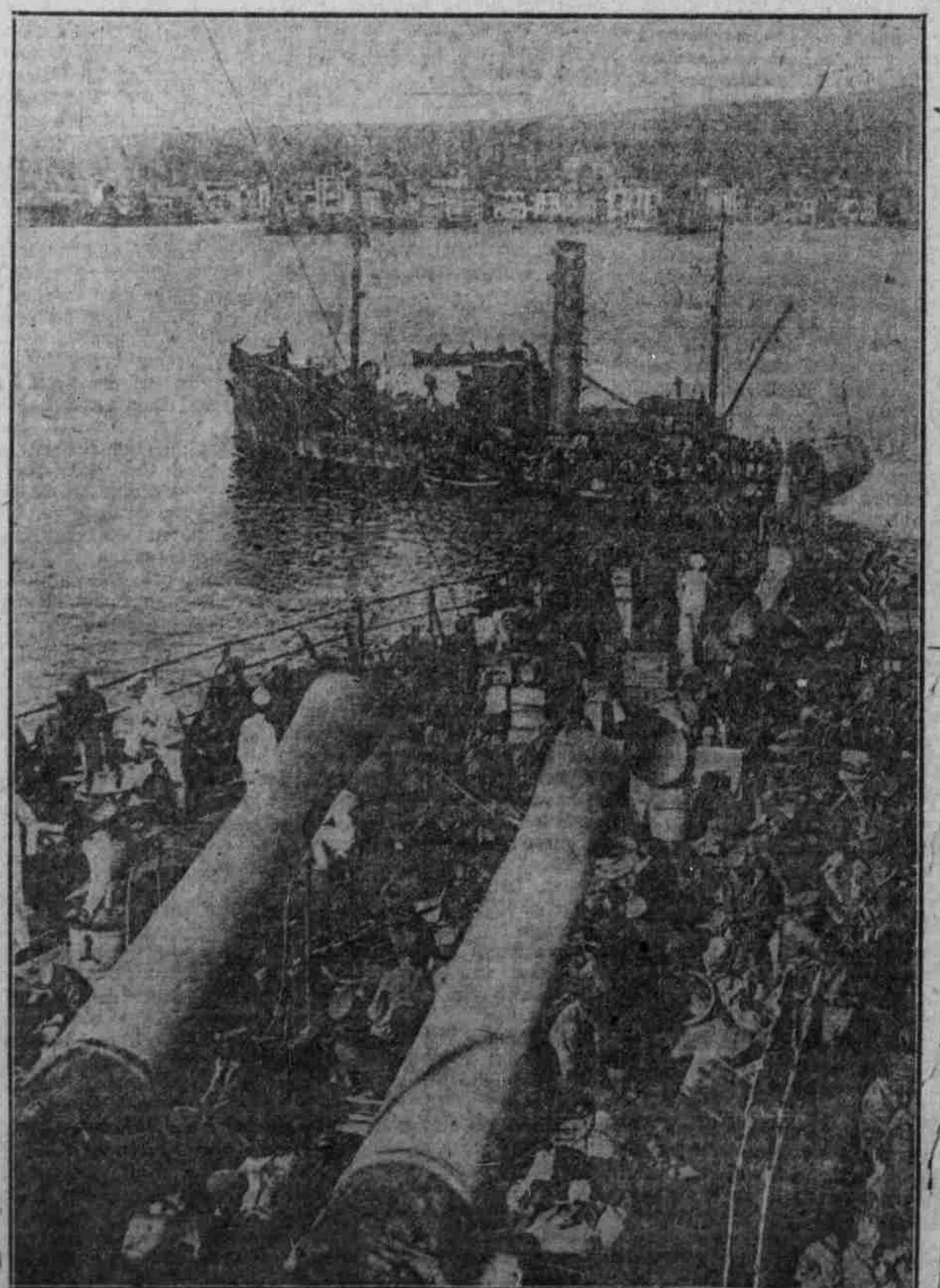
Von der Landung der Bierverbandstruppen in Saloniki: Ein englisches Kriegsschiff fest Truppen ans Land.