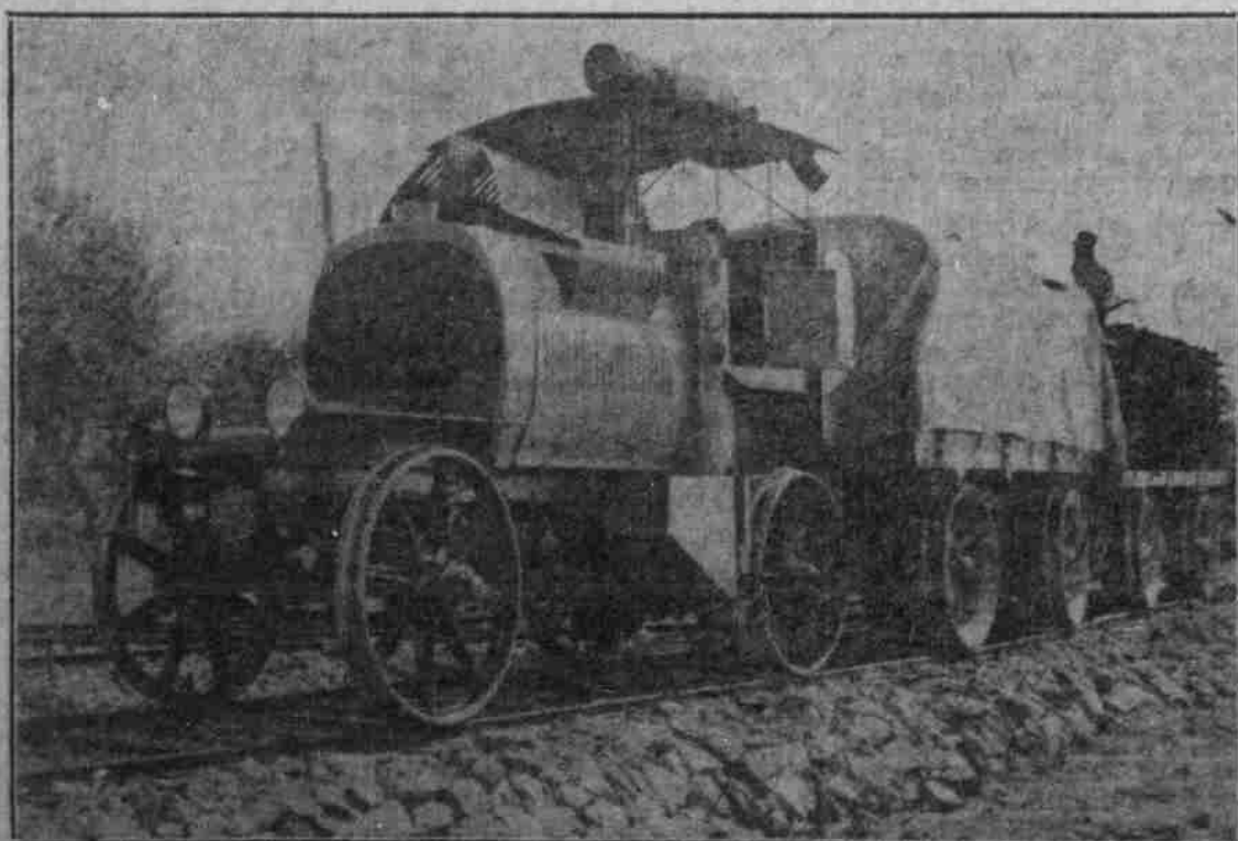
Der Krieg mit Italien: Elektro-Benzin-Feldbahn im Karthagegebiet.

750,000-Mark-Spende in Sachsen. Bei der im Königreich Sachsen veranstalteten Sammlung „Winterspende 1915“ zugunsten der deutschen Truppen und der Gefangenen in Feindesland sind rund 750,000 Mark zusammengelommen.