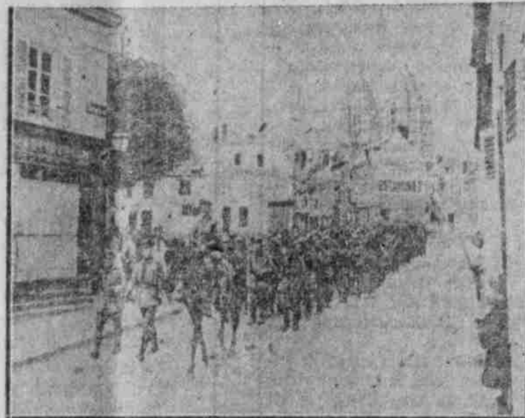
Feindtruppen rücken zur Front ab.