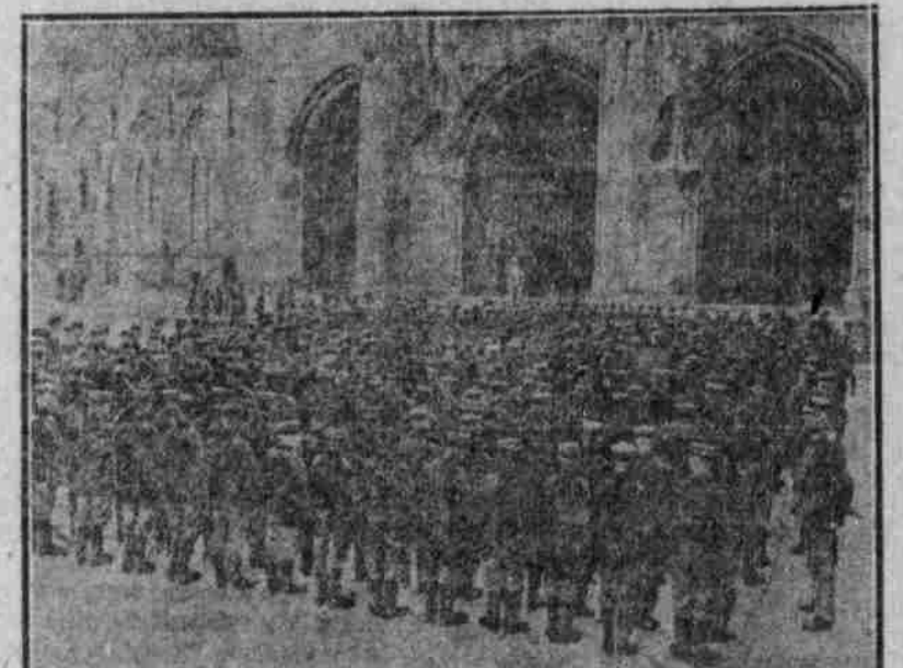
Armierungsgewandenen begeben sich zum Gottesdienst in die Kathedrale.