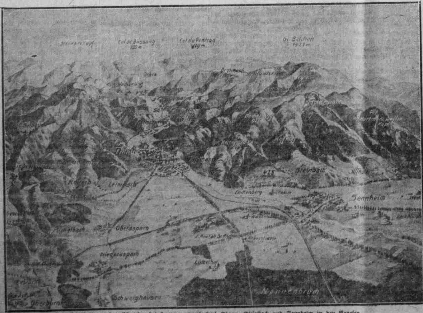
Übersichtskarte zu den Kämpfen bei Hartmannsweilerkopf, Znan, Steinbach und Sennheim in den Vogesen.