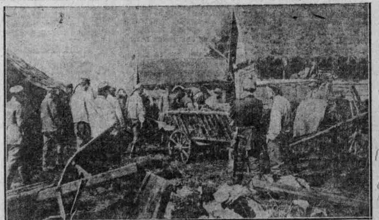
Deutscher Hauptverbandplatz in einem polnischen Dorfe: Verletzte werden in Bauernwagen weggeführt.