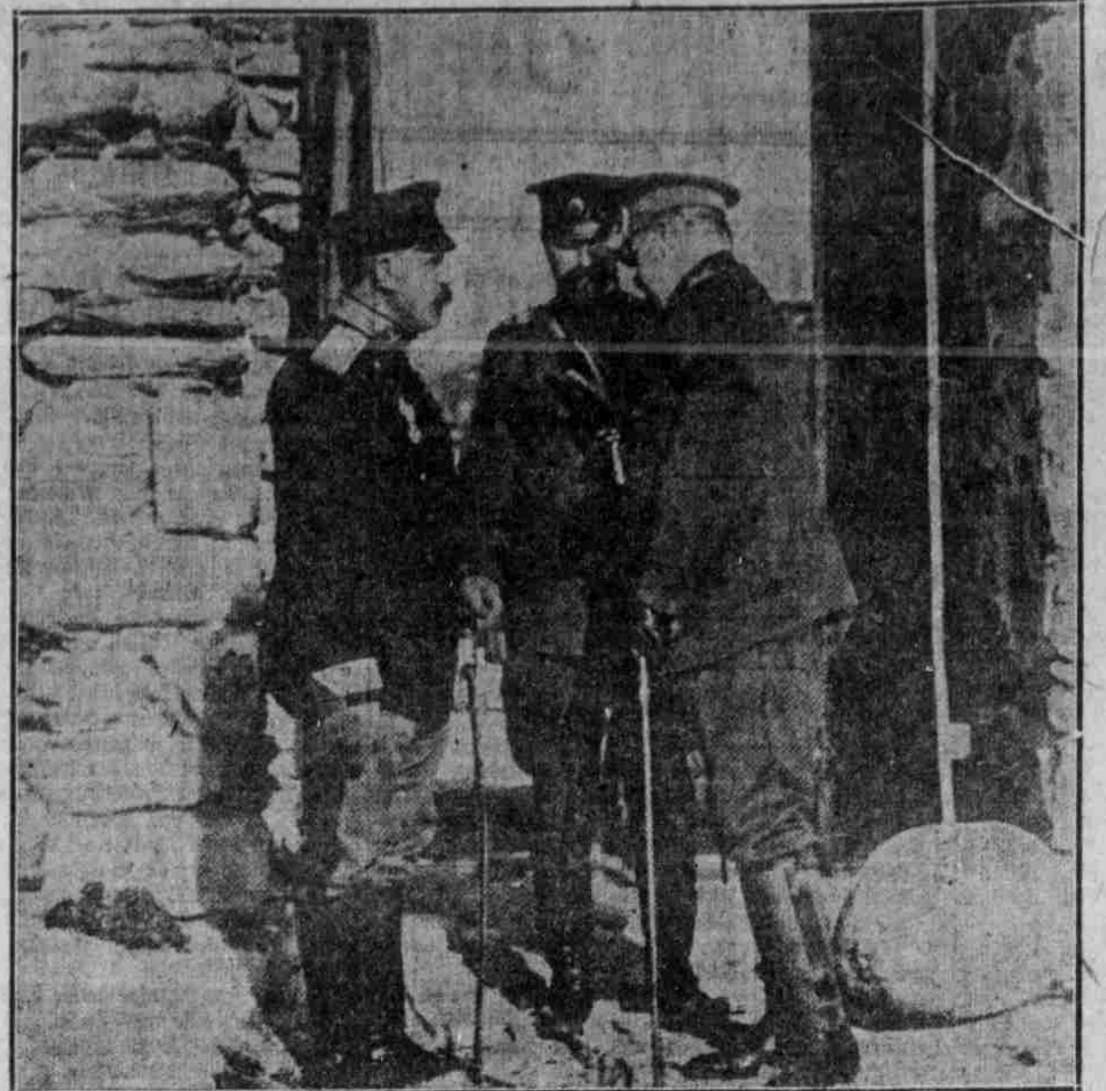
König Ferdinand von Bulgarien (rechts) im Gespräch mit zwei bulgarische Generalen.