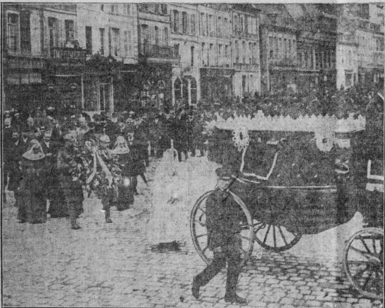
Nach den von deutschen Truppen besetzten Gebieten Nordfrankreichs: Begräbnis von 5 durch englische Fliegerbomben in Veron getöteten französischen Zivilpersonen. Die getöteten französischen Zivilisten werden, wie im Bilde, mit militärischen Ehren zur letzten Ruhe begleitet. Die deutsche Kommandeur von Veron stiftete einen Kranz, den zwei deutsche Soldaten den Leichenwagen nachtragen.