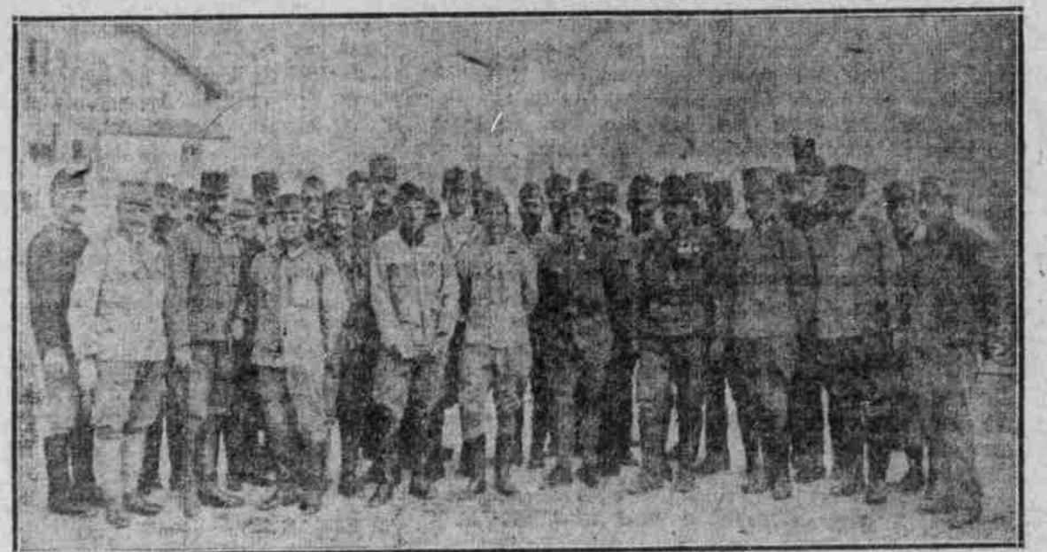
Feldmarschallleutnant Remegel (X) und die Herren seines Stabes mit den Medaillen, deren Brust die Goldene Tapferkeitsmedaille schmückt, die sie in harten Kämpfen gegen die Italiener erworben haben.