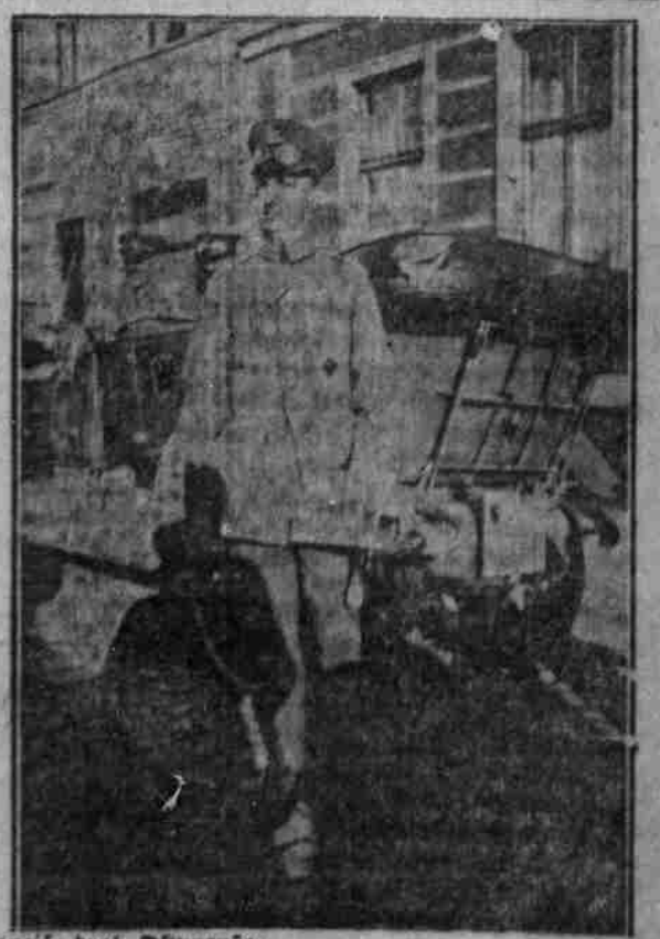
Von der Journalistenreise durch Ostpreußen.