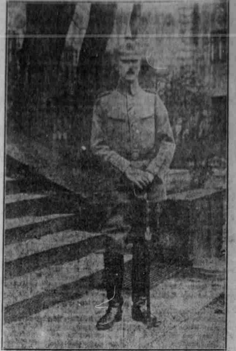
Herzog Carl Eduard von Sachsen-Coburg-Gotha.