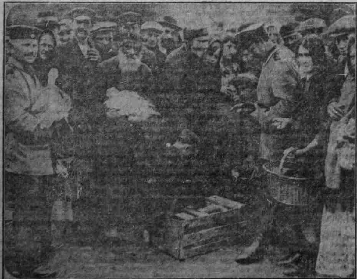
Belgrader Kasse als Einkäufer auf dem Geflügelmarkt einer Stadt Ostschonens

Geistes Brot für Frankreichs Gefangene. Die Gefangenen in Frankreich erhalten eine besondere Art von Dauerbrot; es wird aber von gewissenlosen Spekulanten nach der „Bataille syndicaliste“ vom 13. Juli in einem so harten und so verfaulten Zustand geliefert, daß es ungenießbar ist. Welsch haben sich die Gefangenen darüber beklagt. — Die Zeitung erhofft Abhilfe von der Erfindung eines neuen Dauerbrotes, das sich 4 bis 6 Wochen taubellos halten soll.