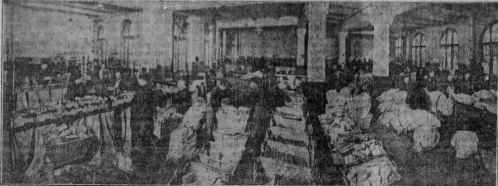
Der Hauptsaal der Feldpostsammlung in Berlin: Die Feldpostfächer werden versandfertig gemacht.