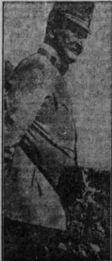
Feldmarschall-Leutnant, Goringler, der Führer einer starken österreichisch-ungarischen Gruppe, die gegen Italien kämpft.