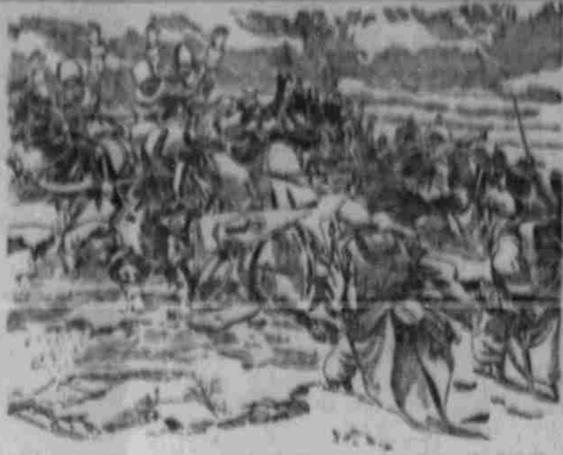
Bei der Besichtigung der 10. russischen Armee vor Kaugulino...