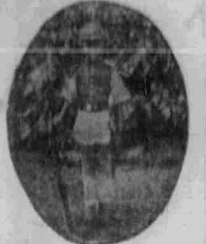
Wang-Afrika beim Anmarsch in den Kampf...