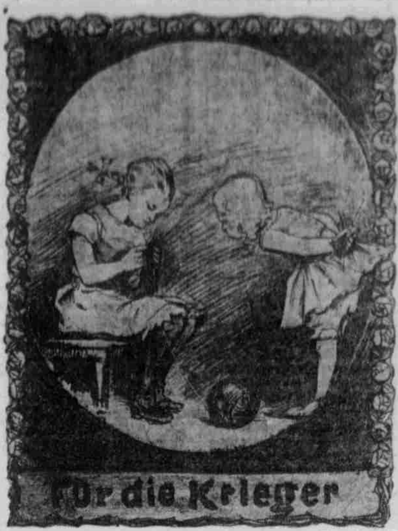
Für die Krieger