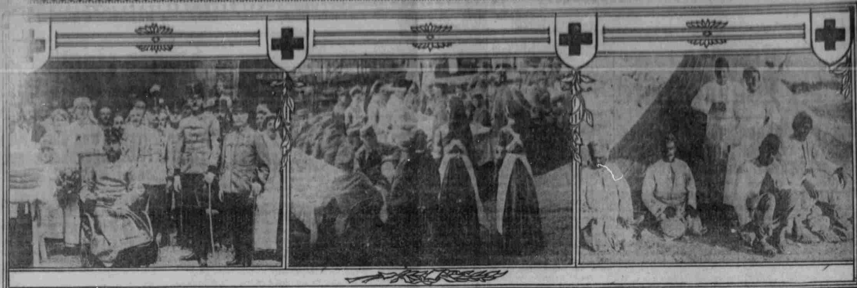
Erzherzogin Marie Theresia (Schwester Michaela x) im Kreise der Anstaltsärzte und Verwundeten.