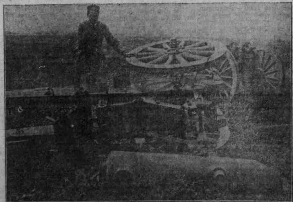
Ein schweres russisches Geschütz, das durch Geschosse eines deutschen Rotorschwerer vollständig vernichtet wurde.