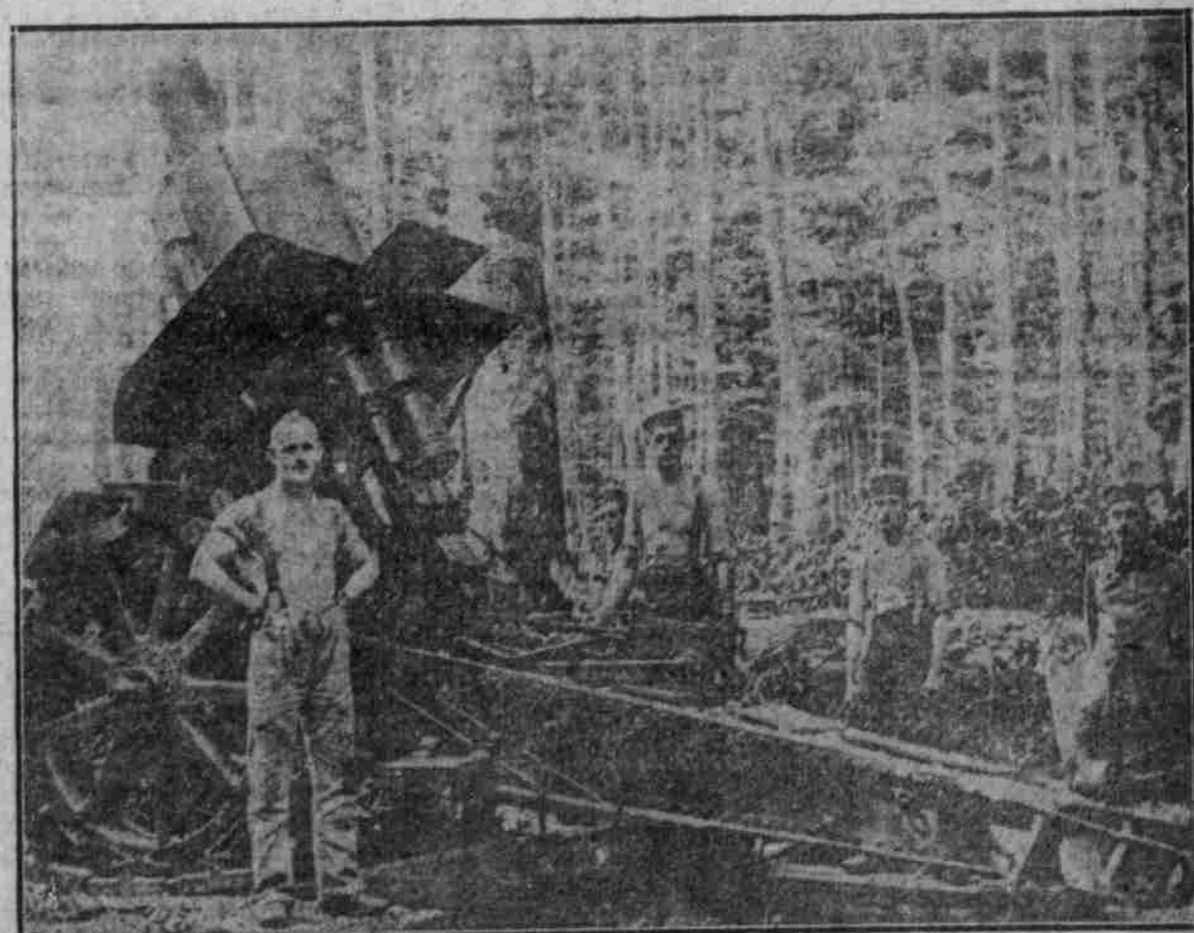
Deutsche 21-cm.-Gaubitze in gedeckter Stellung in einem Walde auf dem westlichen Kriegsschauplatz.