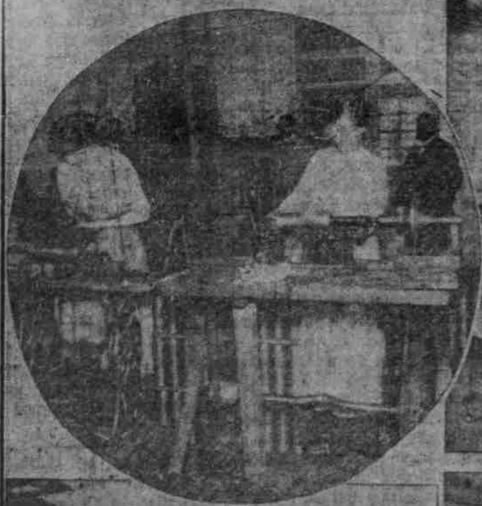
Die Herstellung der Granate.