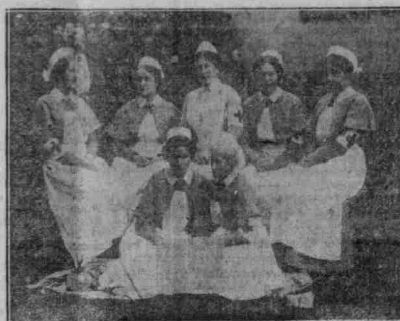
Pflegereinen im Felde.