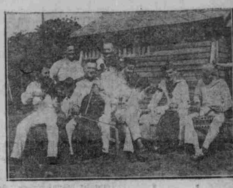
Kriegesgefangenen-Kapelle in Kurume, Japan.