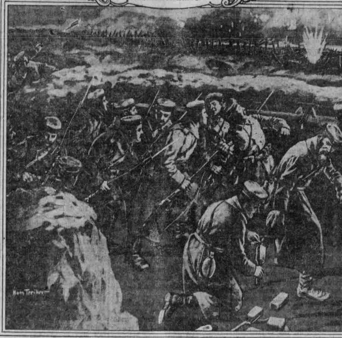
VOR DEM STURM AUF EINEN SCHÜTZENGRABEN.

Die strategische Lage in den Argonnen vor dem 13. Juli. — Der „zuerstkommende“ Angriff der Deutschen. — Heldenthaten der schlesischen Jäger und anderer Truppen. — Deutsche Erfolge und französische Verluste. — Die amtlichen gallischen Angaben.