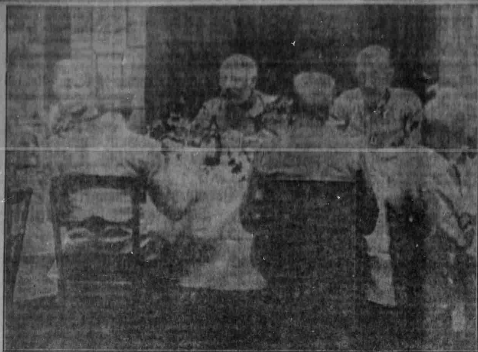
Generaloberst Conrad v. Höbenorf, Feldmarschall Gribnerog Friedrich, General v. Böhm-Ermolli.