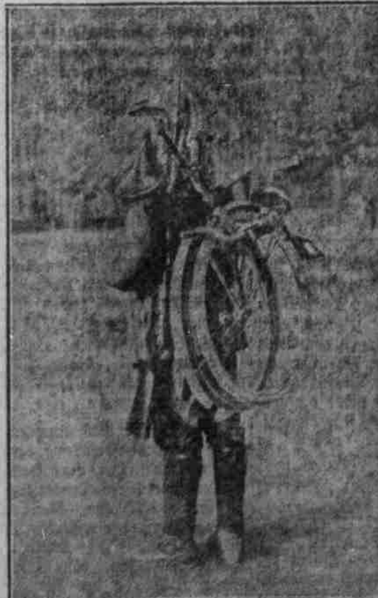
Bayrischer Radfahrer, fertig zum Marsch.