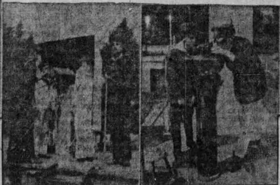
An der Bordkanone. Am Kampab.