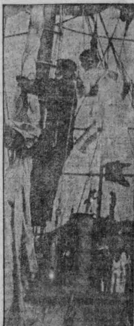
Hängend auf dem Entschaken