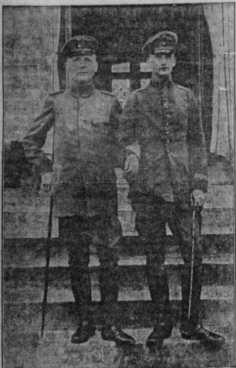
Generaloberst von Einem, der Führer der dritten Armee, mit seinem Sohn vor seinem Hauptquartier in Frankfurt.