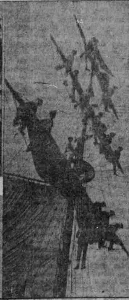
Im Taktwech des Schulkiffes.