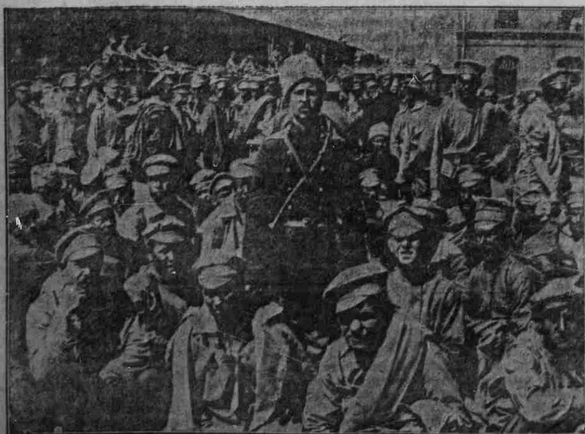
Gefangene Russen aus den Kämpfen in Galizien auf dem Abtransport in die Gefangenschaft.