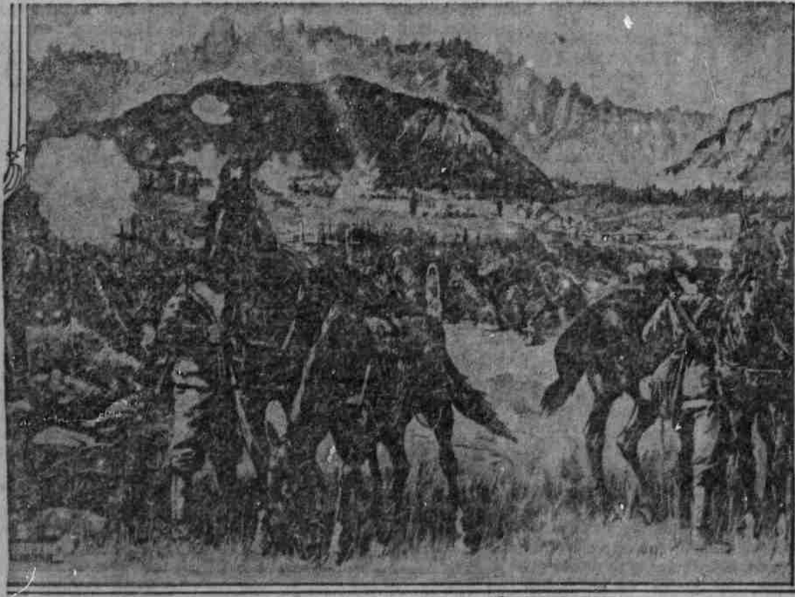
Karavane an der Tiroler Grenze.