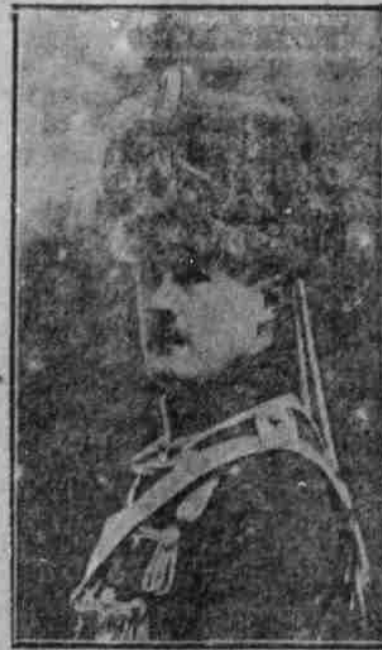
Graf Krupp von Bohlen und Halbach, Chef der Firma Friedr. Krupp, Essen, welche die berühmten 42 cm. Geschütze herstellt.