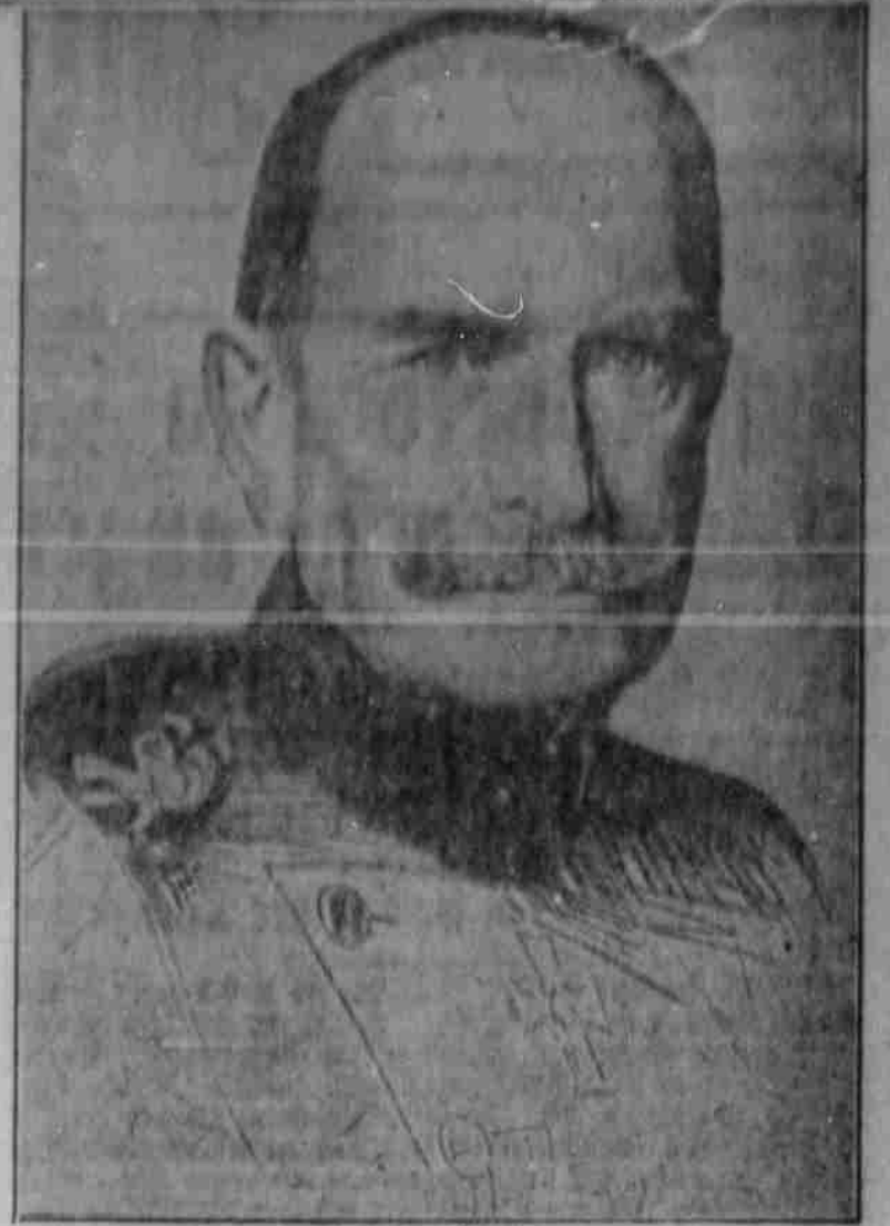
General v. Seizer. Der Eroberer von Antwerpen und von Romo Georgievoff.