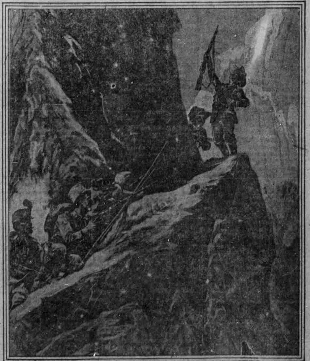
Oesterreichische Kaiserjäger und italienische Bersagliere.