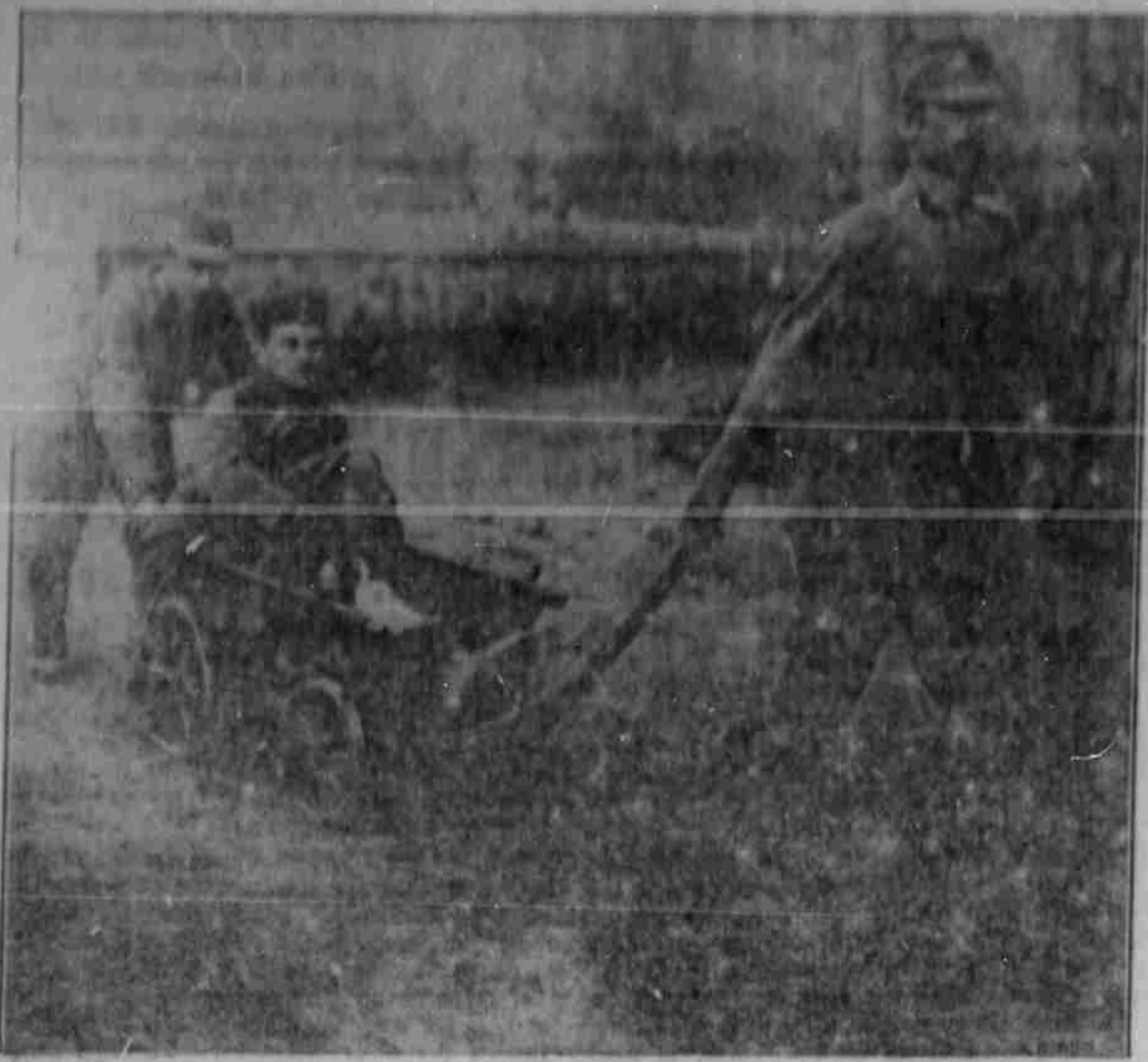
Oesterreichische Soldaten schaffen einen deutschen Verwundeten mit einem Sanftwagen zum Lazarett.