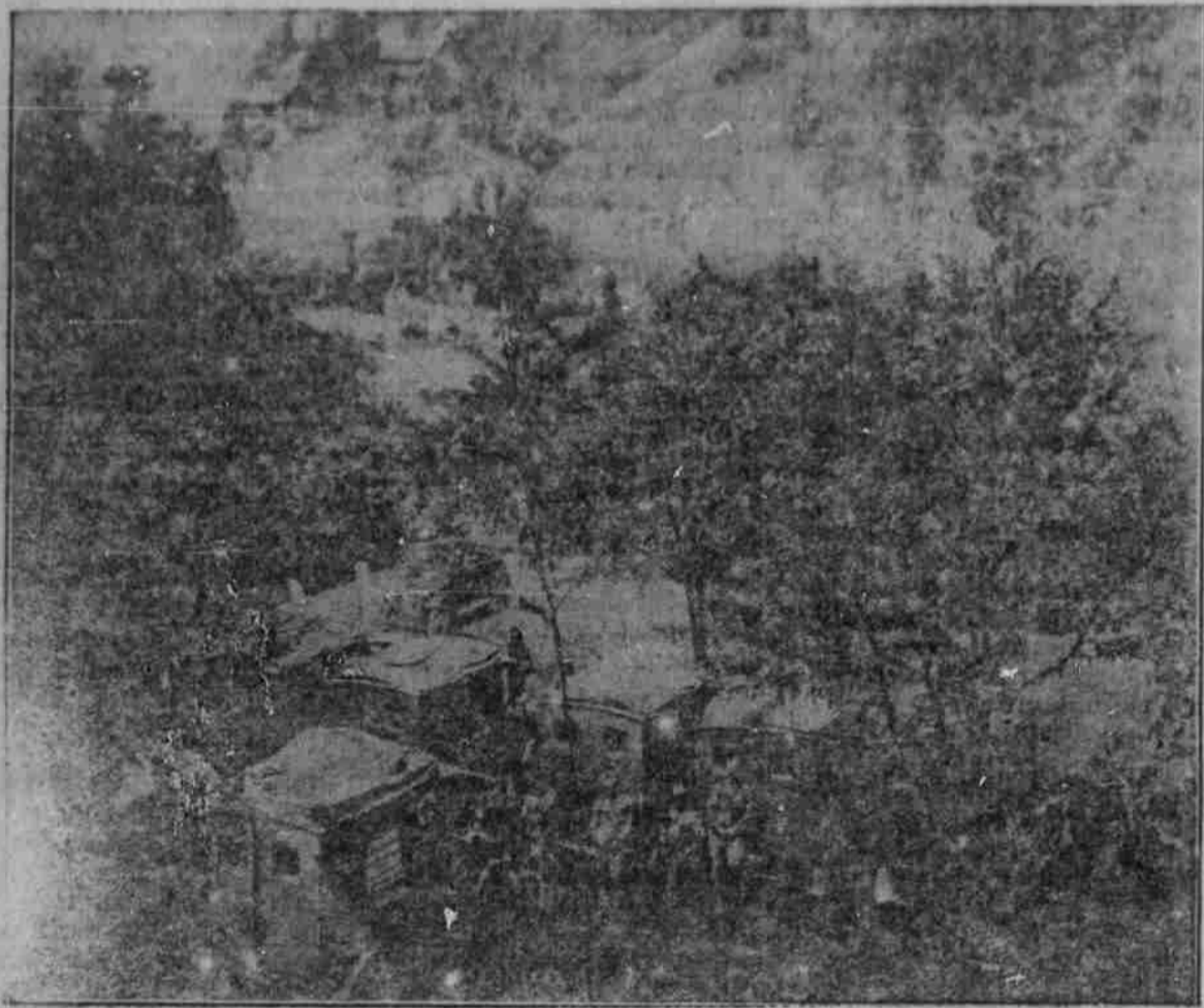
R. und K. Automobilsanitätskolonne auf dem südlichen Kriegsschauplatz.