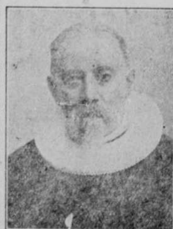
Pastor Vilhelm Beck.

Bogens Tone er helt igennem letfattelig og livlig, og Skildringerne tilkendegiver lei, at Forfatteren har haft Kærlighed til og Forstaaelse af sit Arbejde. Den danskfødte Læser vil med Glæde genkende i hvert Fald sin Hjemstavn, og rimeligvis andre Egne, som de passerer forbi hans Blik i Læsestoffet el-