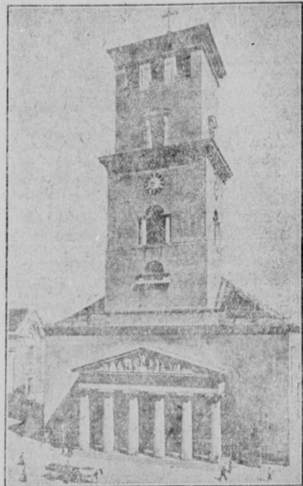
Vor Frue Kirke i København.