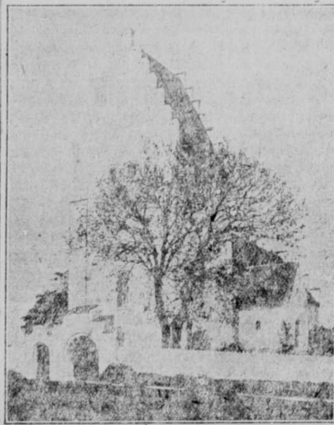
Elmehunde Kirke paa Møen.

Med dette Værk er der for første Gang givet danske Læsere i Amerika Adgang til en samlet og kyndig Oversigt over Nutidens Danmark fra ethvert Synspunkt, saavel Landbruget som Handelen og Industrien samt en omfattende Skildring af Naturen paa de forskellige Egne, ledsaget af Billeder fra praktisk talt enhver Kant af Landet. Bogen er Resultatet af fire Aars Samarbejde, og en notabel Stab af ledende Mænd i Danmark, hver paa sit Omraade, har bidraget til af