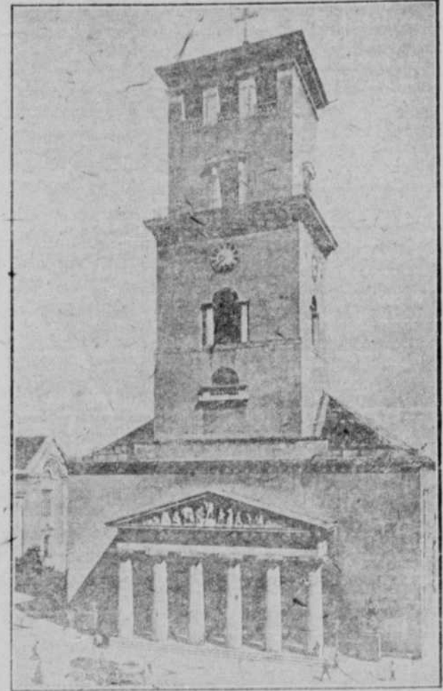
Vor Frue Kirke i København.

Med dette Værk er der for første Gang givet danske Læsere i Amerika Adgang til en samlet og kyndig Oversigt over Nutidens Danmark fra ethvert Synspunkt, saavel Landbruget som Handelen og Industrien samt en omfattende Skildring af Naturen paa de forskellige Egne, ledsaget af Billeder fra praktisk talt enhver Kant af Landet. Bogen er Resultatet af fire Aars Samarbejde, og en notabel Stab af ledende Mænd i Danmark, hver paa sit Omraade, har bidraget til at