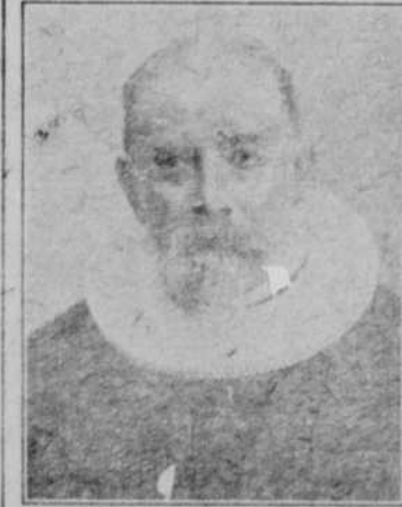
Pastor Vilhelm Beck.

Bogens Tone er helt igennem letfattelig og livlig, og Skildringerne tilkendegiver let, at Forfatteren har haft Kærlighed til og Forstaaelse af sit Arbejde. Den danskfødte Læser vil med Glæde genkende i hvert Fald sin Hjemstavn, og rimeligvis andre Egne, som de passerer forbi hans Blik i Læsestoffet el-