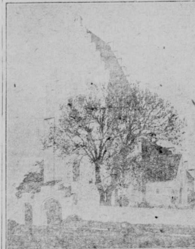
Elmelunde Kirke paa Møen.

I enkelte Settlementer og Byer vil Bogen blive forhandlet gennem Agenter, som selvfølgelig har paataget sig dens videste Udbredelse. Hvor Agenter ikke findes, anbefales