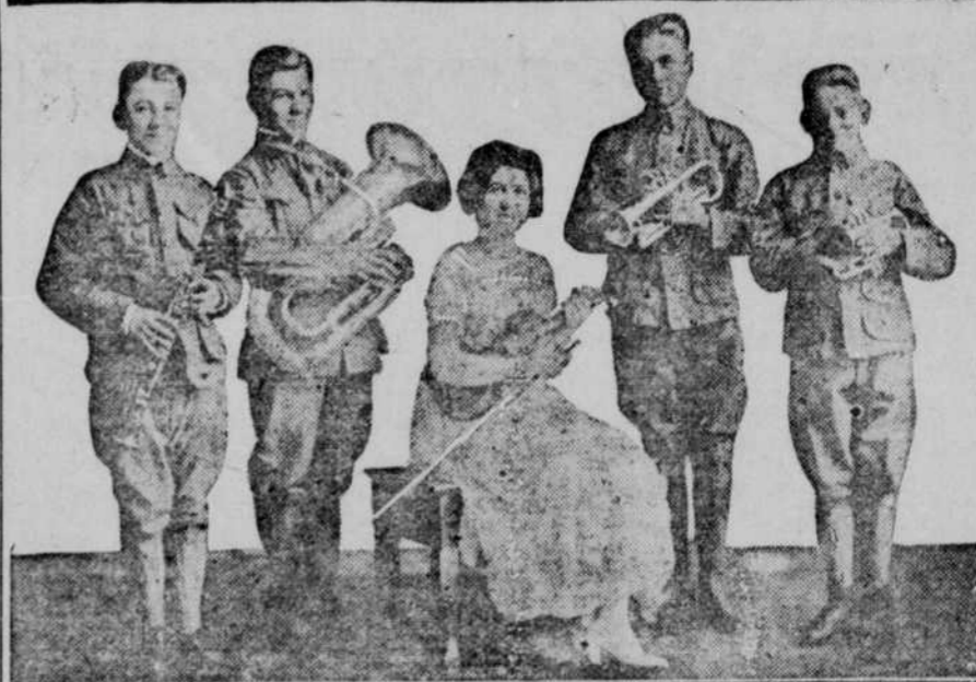
This splendid company 4th day of the Chautauqua.

UNUSUAL JUVENILE COMPANY ON CHAUTAUQUA PROGRAM