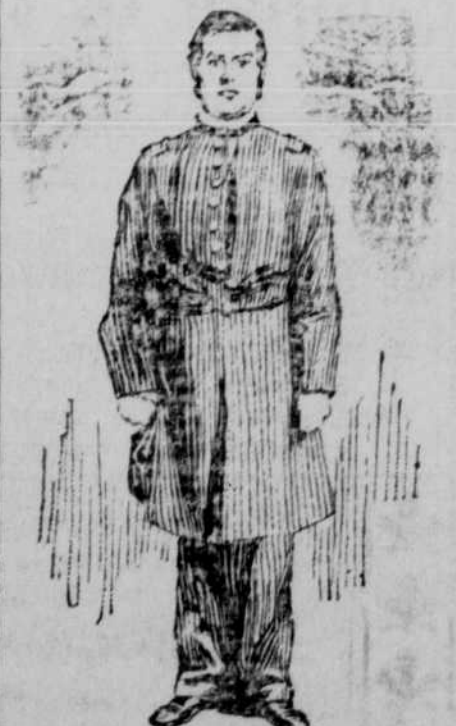
MCKINLEY AS A SOLDIER.

Imidlertid var Borgerkrigen brudt ud. Den 18-aarige McKinley var en af