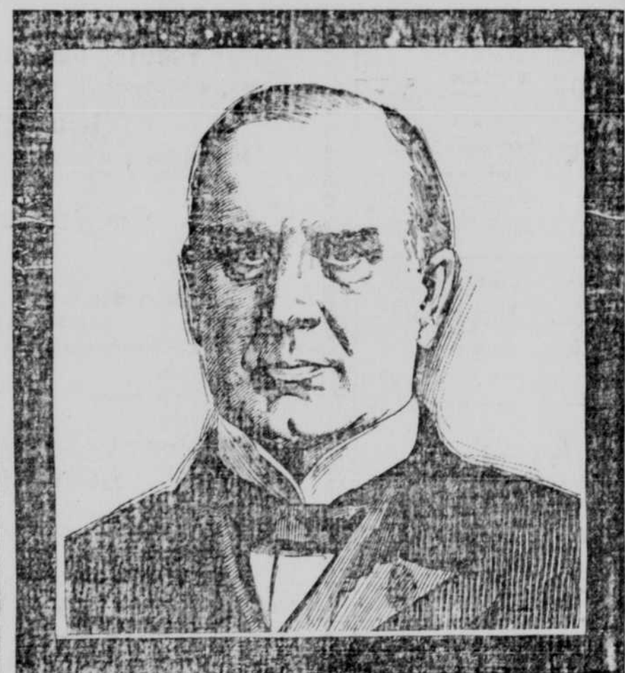
THE LATE PRESIDENT MCKINLEY.

funde oplyses — en Overbevisning, som saa nøje blev den bestemmende Faktor i hans offentlige Liv senere hen. Enhver, baade Amerikaner og Europæer, vil indrømme, at han handlede efter denne sin Overbevisning og sit Vnke til at give den amerikanske Industri dens største Fremstid. I Poland viste den unge William