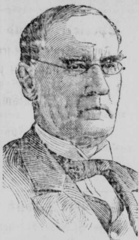
FATHER OF PRESIDENT MCKINLEY.

Senere faldt Faderens Arbejde sammen, en Omstændighed, der sit Indflydelse paa den unge William McKinleys Livsbane. Han lærte den Gang at hjælpe sig selv frem, ligesom han sit den første Overbevisning om, at den amerikanske Industri burde og