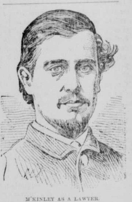
MCKINLEY AS A LAWYER.

demokratisk og republikansk Kandidatur betragtedes kun som — Værestiller. Personlig vindende og elskværdig som McKinley var, vandt han i Valgkampen, og selv gamle Politikere ryttede paa Hovedet ad hans Held.