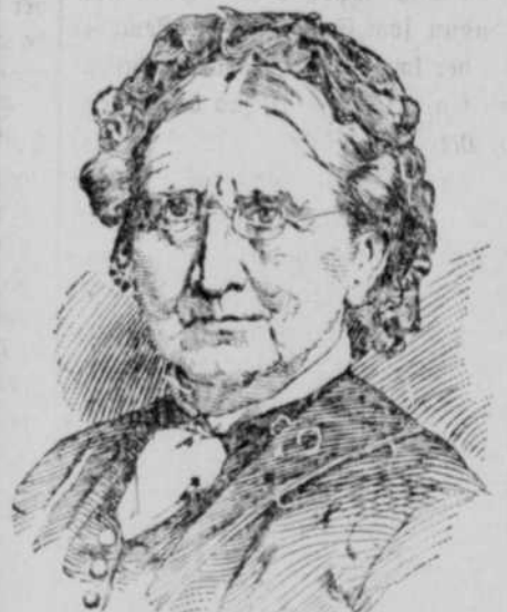
MOTHER OF PRESIDENT MCKINLEY.

hans Reberlag blev Anledning til, at han næste Aar den 3. Nov. 1891 blev valgt til Ohios Guvernor med et Flertal paa 21,511, til Trods for, at hans Modkandidat var selve den demokratiske Guvernor James E. Campbell.