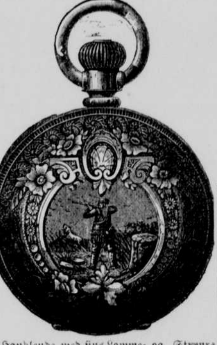
Håndlende med fine Vommeg og Stævre og Juveler. Altting garanteres. Bring ind Gærs Ure og Klokke og saa dem repareret.

Konditioner: - Bølsk paa $10 og under. Kontant; Bølsk over $10, 12 Maanedders Rent med tilfærdigende Sikkerhed og Kote bærende 10 pct. Rent. 5 pct. Rabat for Kontant. E. Smith, Auktionaer.