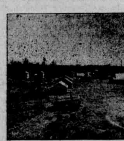
Pohled na nově založené městečko Tony na "Soo" dráze ve Wisconsinu, s továrnou na dužiny, zaměstnávající 60 lidí.

Kraj tento jest úplně osazen a skoro všemě vzdělán, celé údolí jest rovno, pouze kde se blíží k horám, jest místy kopcovité, ač i tam dáse 20—30 mil od řeky Willamette jsou velká údolí a velice úrodná, ano úrodnější než pobřeží řeky a jsou mnohem levnější jak koupí než v okolí větších měst. Jak řečeno, údolí toto jest ve směs vzdělané, ač místy, zvláště na úpatí hor, jest hojnost lesa a sice lesa nejlepšího. Stromy jsou velmi rovné a dosahují značné výše, 200—300 stop. Jsou zde borovice, smrky, duby, osy