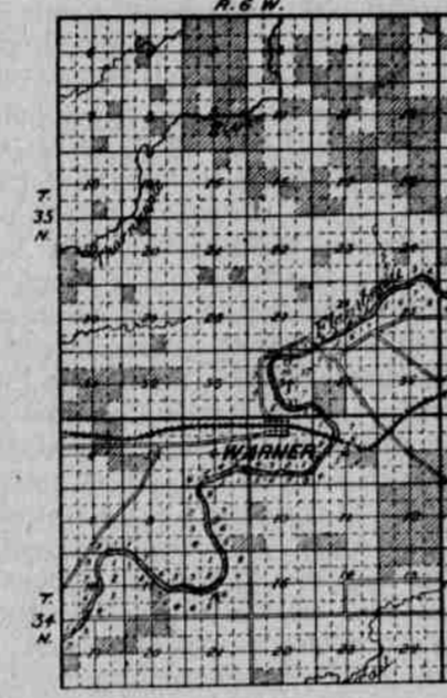
Mapa ukazuje ei pozemky "Soo" dráhy, v okolí Tony a Warner ve Wisconsinu. Sekce vytvářované nabíjí dráhu ku protělu.

Kotlina, neb údolí toto jest asi 60 mil široké a asi tolikéž, neb více dlouhé. Středem jeho teče řeka Willamette, jež jest splavná celý rok pro