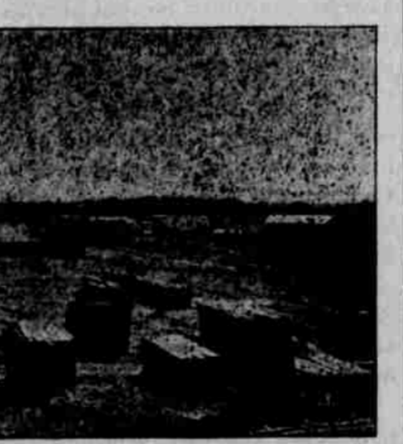
Pohled na nově založené městečko Tony na "Soo" dráze ve Wisconsinu, s továrnou na dužiny, zaměstnávající 60 lidí.

Že nejlepší chmel se zde pěstuje, je světoznámé a ač nyní jest cena jeho nízká, 10—12c. za libru, přece lze vy těžiti hezky peníz z jednoho akru. Sklízí se od 1000 až do 3000 liber z akru a veškerá vřloha neobnáší 5c. za