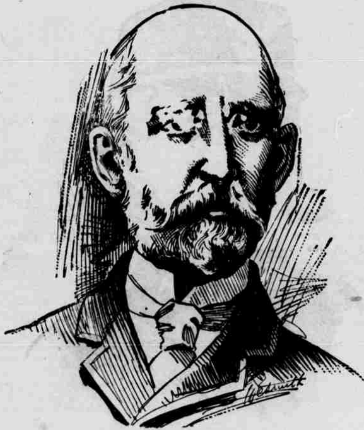
KAPITÁN ALFRED T. MAHAN, člen strategického výboru ve Washingtonu, uznáván jest zde i v Evropě za tu nejlepší autoritu ve věcech námořních.

Jest to ten samý atlas, který někteří ohlašují v ceně $4.00 a prodávají jej za 25 centů. Jelikož není