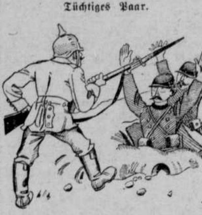
Vater nimmt die Schützengraben ein — und