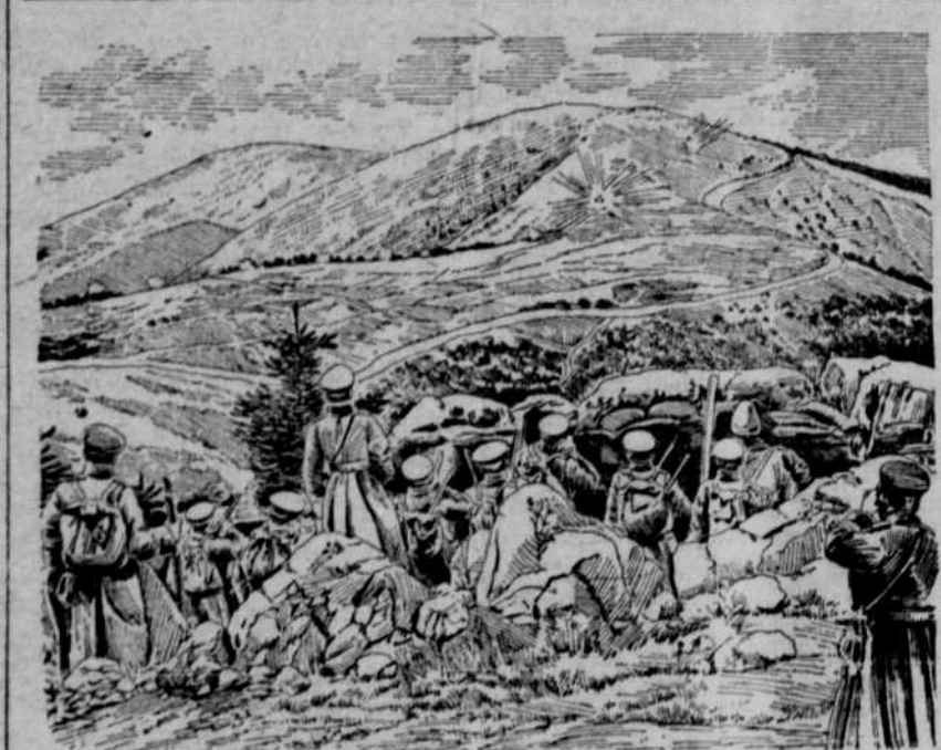
In Abwehr eines serbischen Ueberfalls nehmen Truppen der ersten bulgarischen Armee Vorposten an der serbischen Grenze.

der Juwelier erklärte, die Brosche sei aus falschem Golde, er könne nur 15 Lire dafür zahlen; Fräulein Gramatica habe sich somit bescheiden müssen, nur diese 15 Lire für die