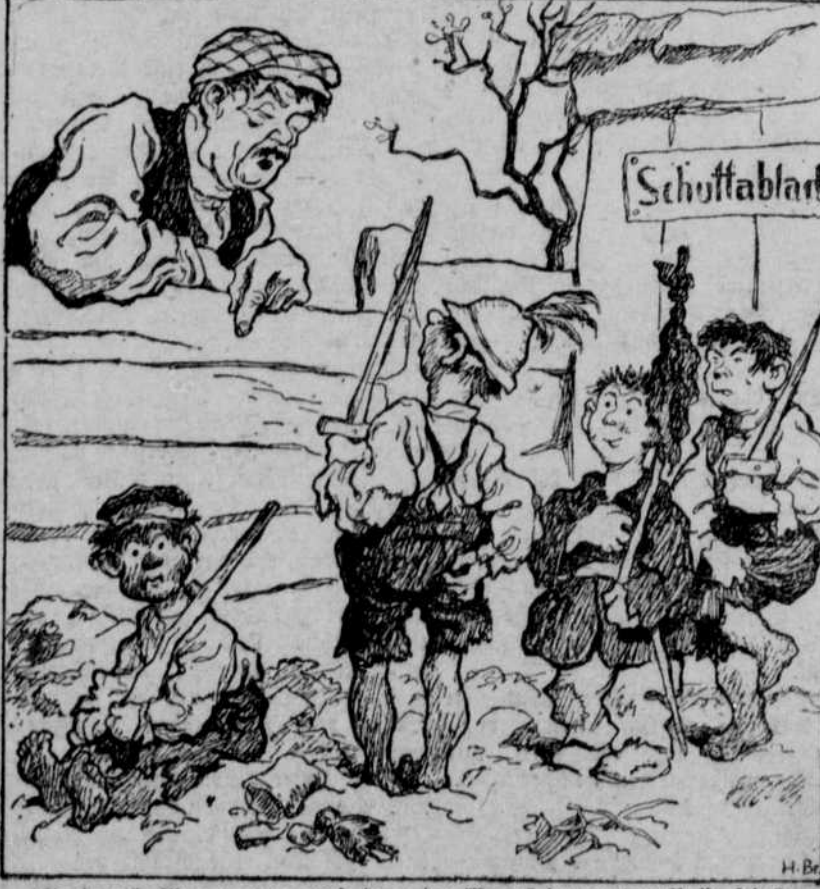
Sag' mal, Max, warum muh denn der Bengel immer der Russe sein? Weil er am meisten Läuse hat. Woher weißt Du das, hat Du sie denn gezählt? Nein, aber der fragt sich schon gar nicht mehr!