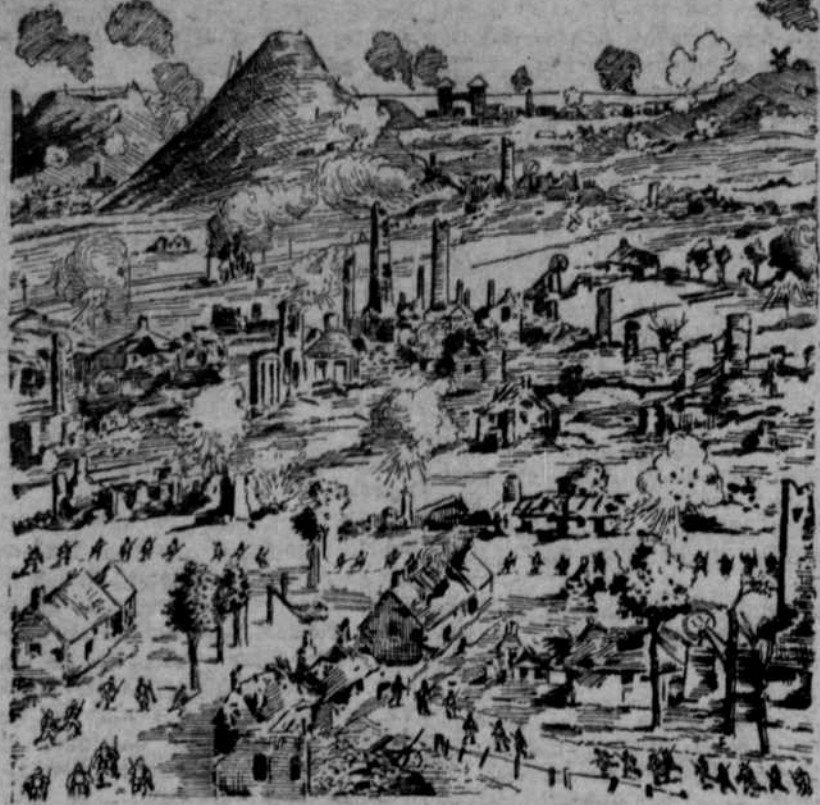
Der Kampf von Loos in englischer Darstellung.