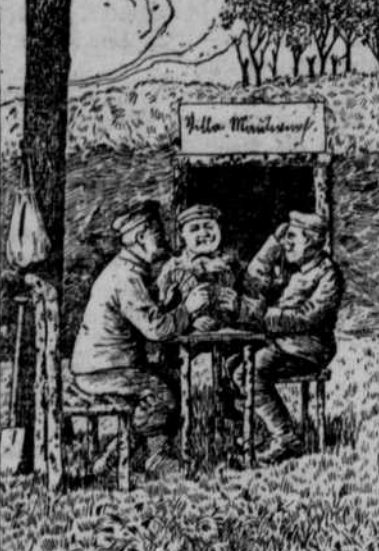
Abends nach dem Uddeln wird der Wagen erd getoppet, und zur Verdaunung hinterher ein Dauerstat gefloppet.