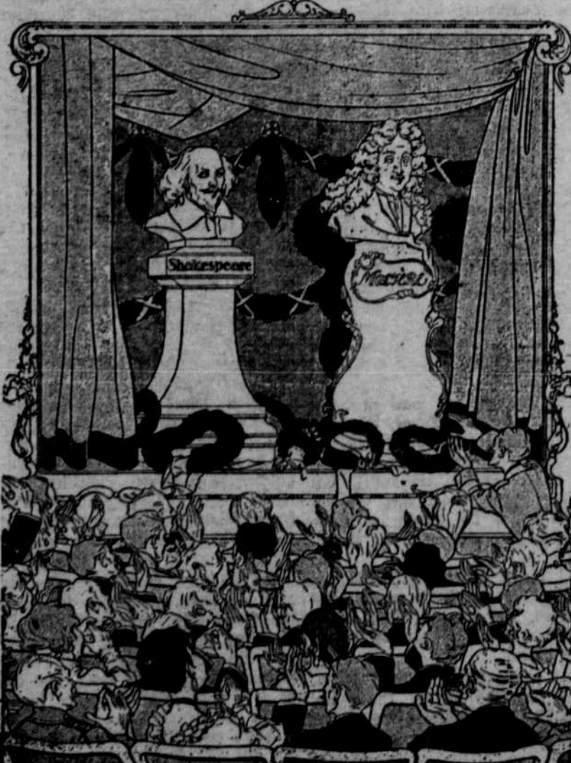
Diese Germanen! Diese Döner! Jeden Abend verhöhnen sie die großen Dichter Englands und Frankreichs! (Berliner „All.“)

Ausgleich. Hausfrau: „Ihr Schatz ist ja aus 'm Felde zurückgekommen, Anna?“ Rächin (traurig): „Ja, aber dafür ist 'n anderer wieder weggegangen!“