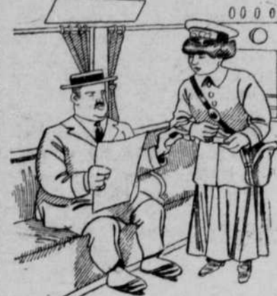
Mutter nimmt die Broschen ein.

Nachbereich des Siegers nicht unterworfen sei. Seine Gedanken sind, wie die Italiener annehmen, der erste Anstoß zu einem großen internationalen Verein zur Pflege der Verwundeten geworden.