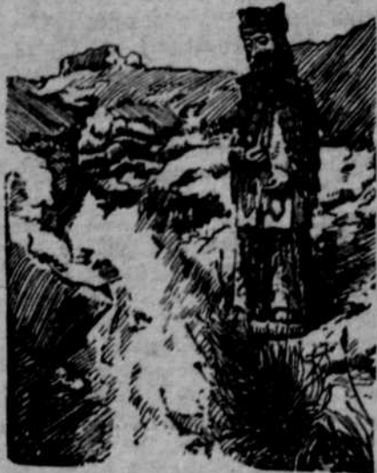
Deutsche Truppen finden solche Heiligensfiguren, die nach dem Glauben der russischen Soldaten den russischen Waffen zum Siege verhelfen sollen, vielfach in den eroberten Schützengraben vor.