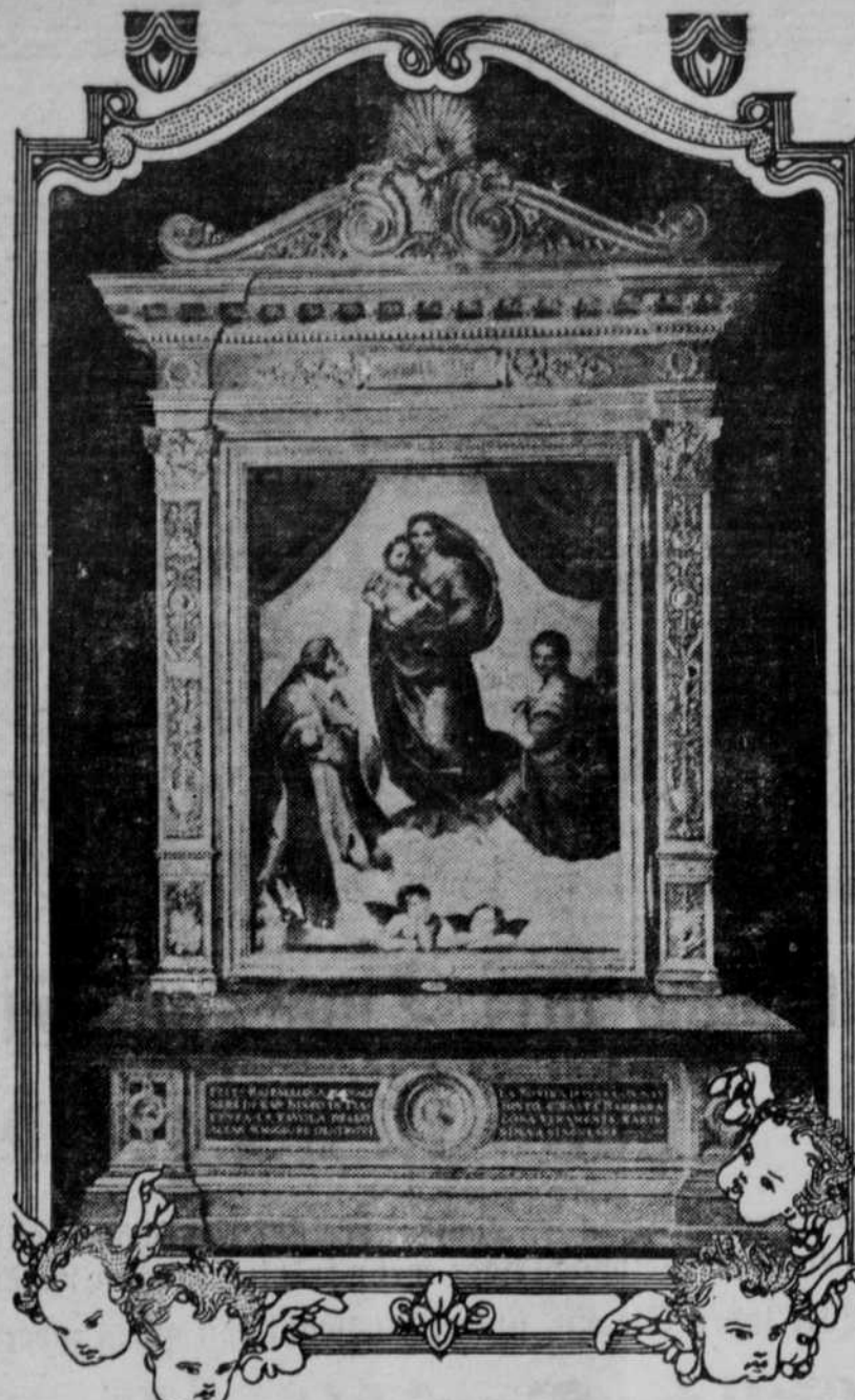
Raphael's Sixtine Madonna.