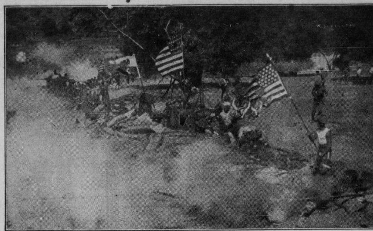
Schlacht-Szene in „The Birth of a Nation“, dargestellt im Vortentach-Theater am Sonntag und Montag, 24. und 25. Dezember. Zweimal täglich — 2:15 Nachm. und 8:15 Abends. Sine in Feiler's Apotheke.