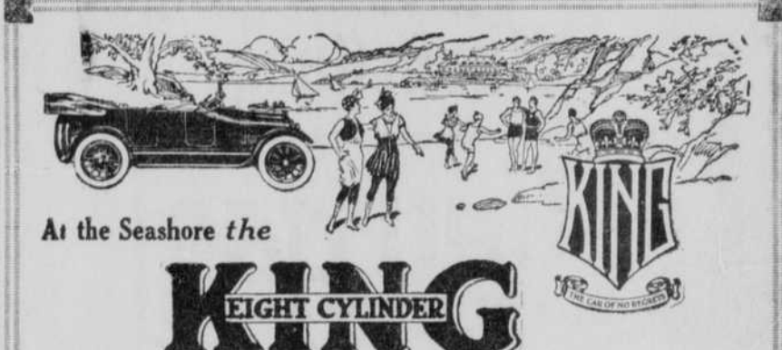
At the Seashore the KING EIGHT CYLINDER

— Was recht ist, empfinden wir — Man nennt oft etwas unehrlich dann am besten, wenn uns selber Unrecht geschieht, weil man's nur näherlich betrachtet hat.