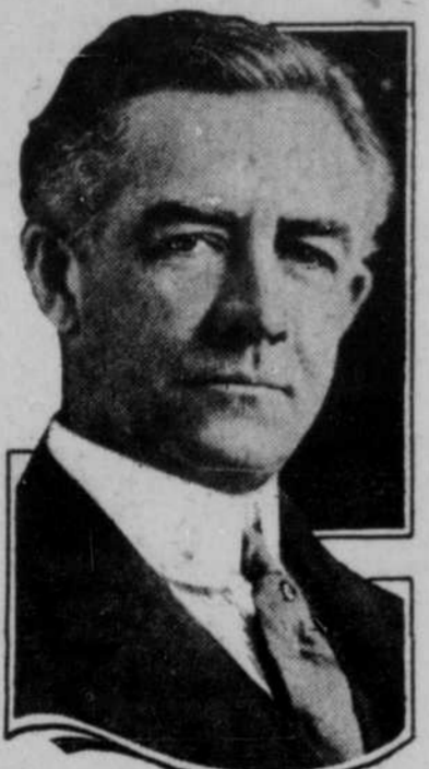
Gilbert M. Hitchcock