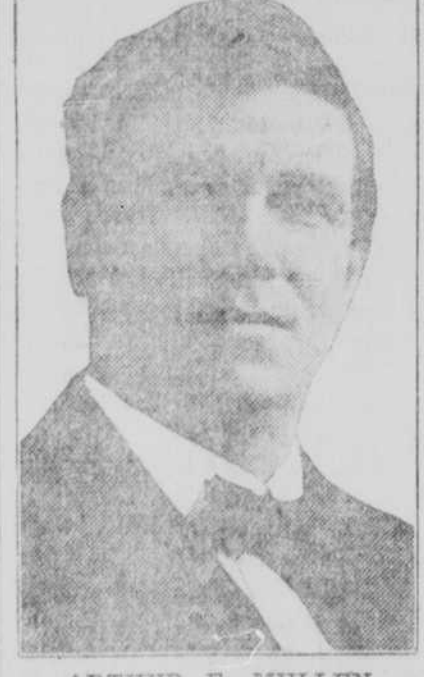
ARTHUR F. MULLEN Omaha, Neb. Candidate for Member of the National Committee of the Democratic Party for the State of Nebraska