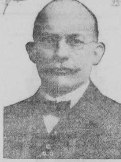
Mayor Charles W. Bryan Demokratischer Kandidat für Gouverneur.