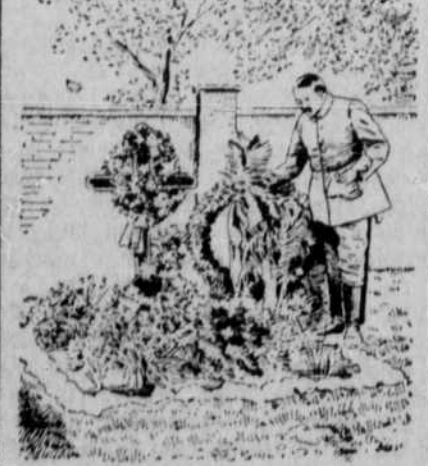
Ein deutscher Offizier legt am Grabe eines bei den vorjährigen Augustkämpfen gefallenen belgischen Hauptmanns einen Kranz nieder.