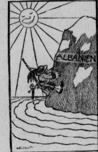
Der Sprung war mir ja schon geübt, aber wie komm' ich nun einmal wieder zurück?