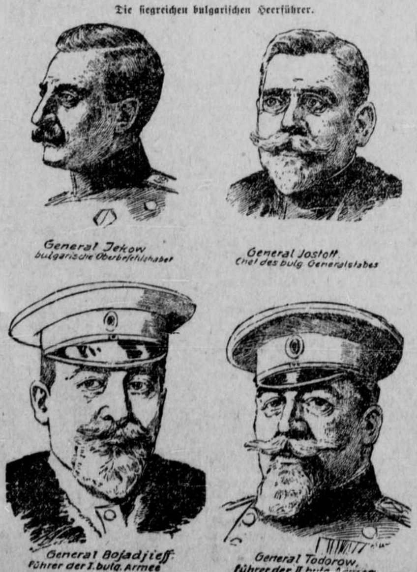
Die siegreichen bulgarischen Vorkämpfer.