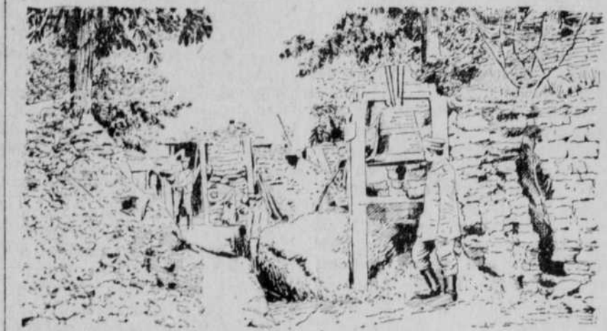
Neueroberte Stellung in einem französischen Dorf. Die Kirchenglocke wird beim Maren geläutet.