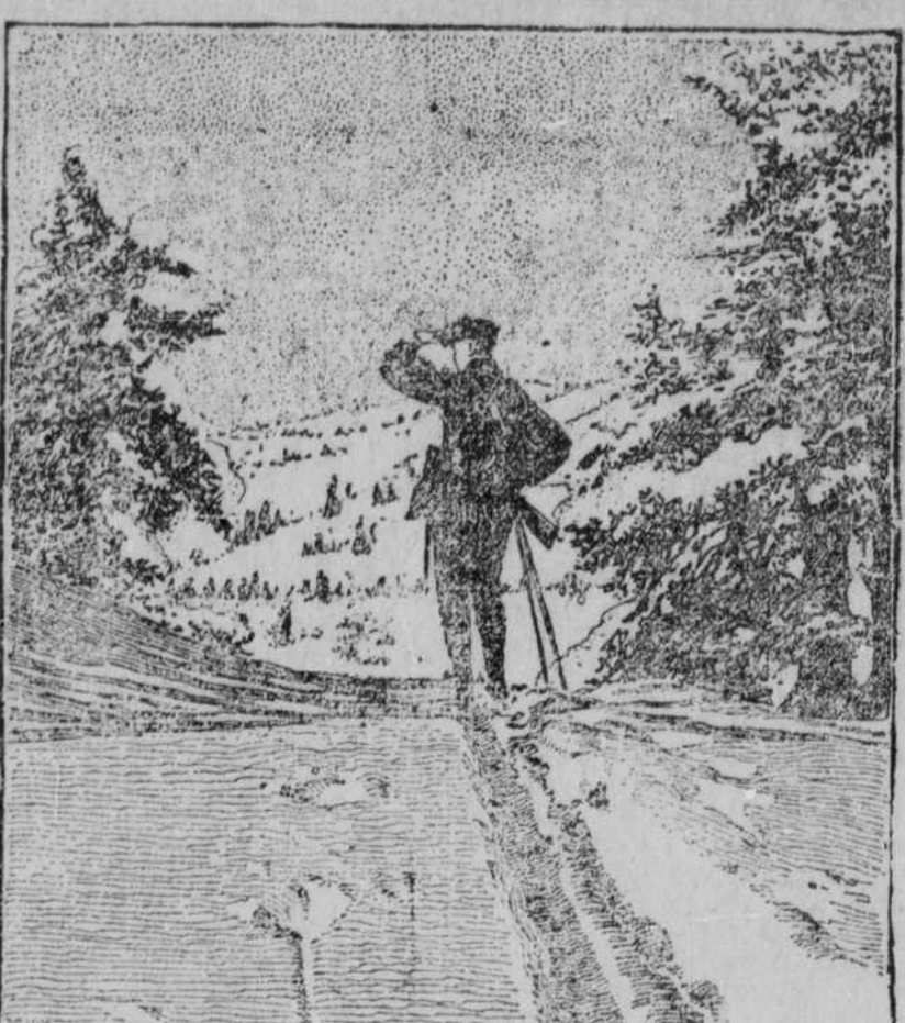
Die deutschen Ski-Truppen haben sich im letzten und diesem Winter in den gebirgigen Gegenden der Kriegsschauplätze mehrfach ausgezeichnet.