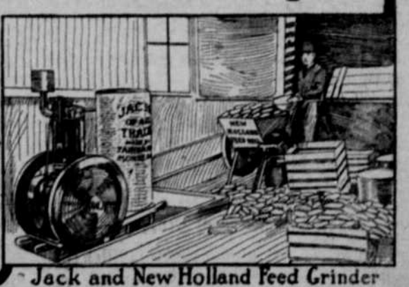
Jack and New Holland Feed Grinders

All kinds & Sizes of Engines 2 to 200 Horse Power Send for Catalog No. 1127 L A FAIRBANKS-MORSE & CO. Omaha, Nebr.,