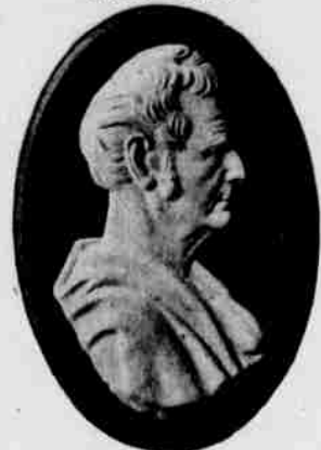
Dal světu ocelový pluh