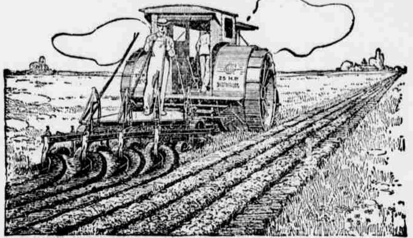
kupte si v čase i polí vyzkoušený I H C hybostroj.

se svým jednoduchým mocným strojem a převodem, pečlivě chráněným před nečistotou, prachem a špínou; s mohutnými, dobře olejevanými ložky; s vlastním lehkou váhou na sílu, kterou vyvozuje; bez nebezpečných výskoků a obtížných sazů a kouřů; jeho všeobecná užitečnost a spolehlivost více nežli přispěla k docelení všech podniků v moderním farmářství. Můžete-li používat hybostroj,