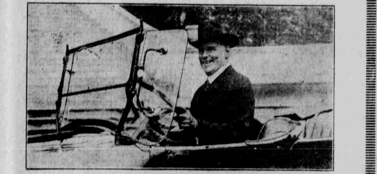
Přidá vašemu automobilu stylu a pohodlí. Chladi za parného počasí.